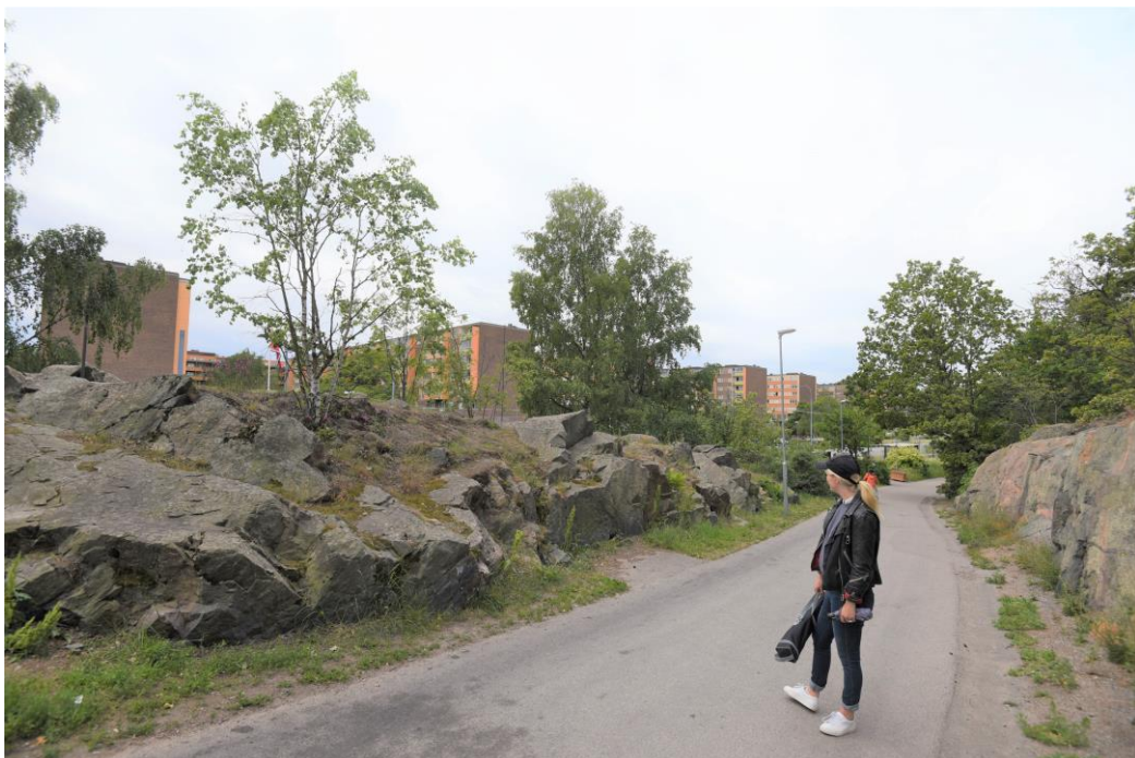
Figur 6. Parallellt med järnvägsspåret löper ett gångstråk som förenar skollokaler i öster med sporthall och idrottsplatser i väster.