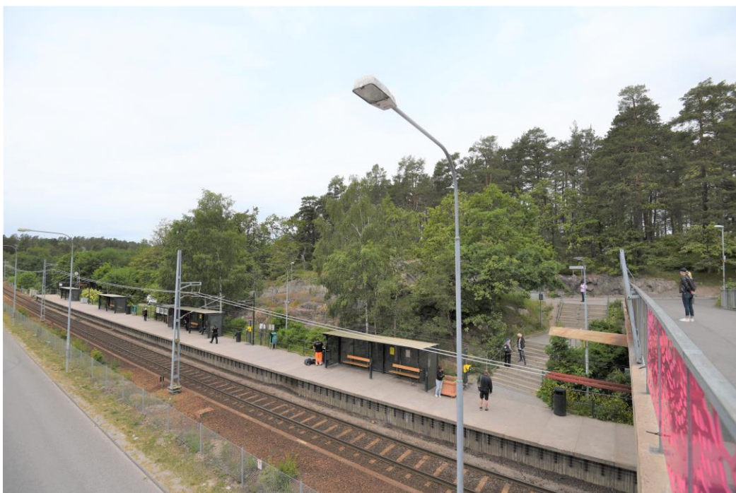
Figur 4. Fisksätra station sedd från gång- och cykelbron över Fisksätravägen. Bergsparti och trappa till gång- och cykelbro syns höger i bild.