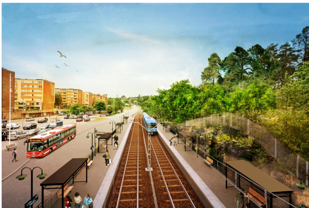
Figur 14. Ett nytt spår med plattform tillkommer mot Fisksätravägen, vy från gångbron i öster. Visualisering av Sweco.