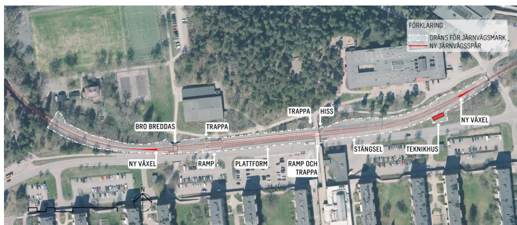
Figur 9. Förändringar.