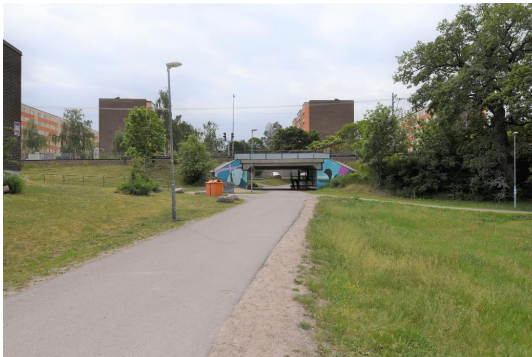
Figur 2. Gång- och cykelpassage under järnvägsbron i västra delen av planområdet. Bostadsbebyggelse i Fisksätra ses i bakgrunden.

Norr om Fisksätra station finns skola, sporthall, idrottsplaner, småbåtshamn, restaurang samt rekreationsområde med naturmark, stränder och badplats på Fisksätra holme. Parallellt med järnvägsspåret löper ett gångstråk som förenar skollokaler i öster med sporthall och idrottsplatser i väster.