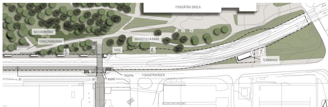
Figur 11. Bild från PM med gestaltungsprinciper, östra delen av planområdet.

Väster om spårområdet finns ett bevarat naturområde. Genom området går en gång- och cykelväg som sammankopplar Fisksätra centrum med det närliggande bostadsområdet Fiskarhöjden. Området bör förslagsvis renas från sly och trädgårdsavfall. Genom det får området ett städat intryck samtidigt som siktlinjer ökar. Något som är extra viktigt vid gång- och cykelbanans kant, då det ökar känslan av trygghet. Kopplingen mellan centrum och Fiskarhöjden stärks genom att binda samman den befintliga gång- och cykelbanan med den nya som tillkommer längs efter den södra sidan av Fisksätravägen. En gångväg ansluter även från södra spårområdet till Fiskarhöjden.