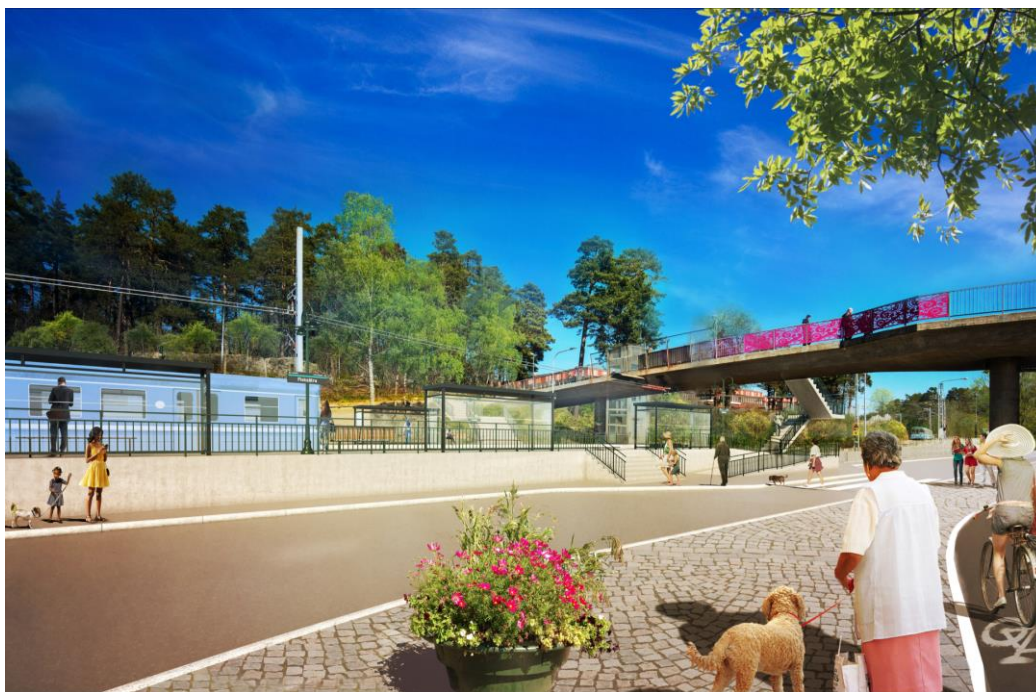
Figur 12. Spårområdet breddas för att rymma dubbelspår och plattformar, vy från söder. Hiss och trappa leder upp till gångbron. Visualisering av Sweco.

Trafikförvaltningen har tagit fram ett gestaltungsprogram för plattformarna och ett PM med gestaltungsprinciper för omkringliggande landskap. Gestaltningen av området bedöms tillföra positiva kvaliteter i området. Trafikförvaltningen (2019) har låtit ta fram vybilder för att illustrera hur stads- och landskapsbilden kan komma att upplevas av betraktaren, se figur 12 och figur 13. Inga skyddsåtgärder med avseende på stads- och landskapsbild har föreslagits att införas i planen.