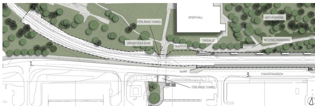
Figur 10. Bild från PM med gestaltungsprinciper, västra delen av planområdet.