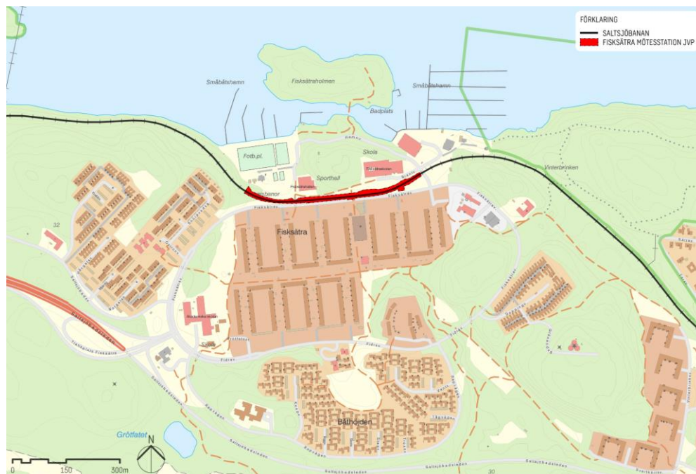
Figur 1. Översikt planområde

Figur 1 visar aktuellt planområde för mötesstationen i Fisksätra. Planområdet sträcker sig mellan km 11+350 – km 11+860 i järnvägens längdmätning.