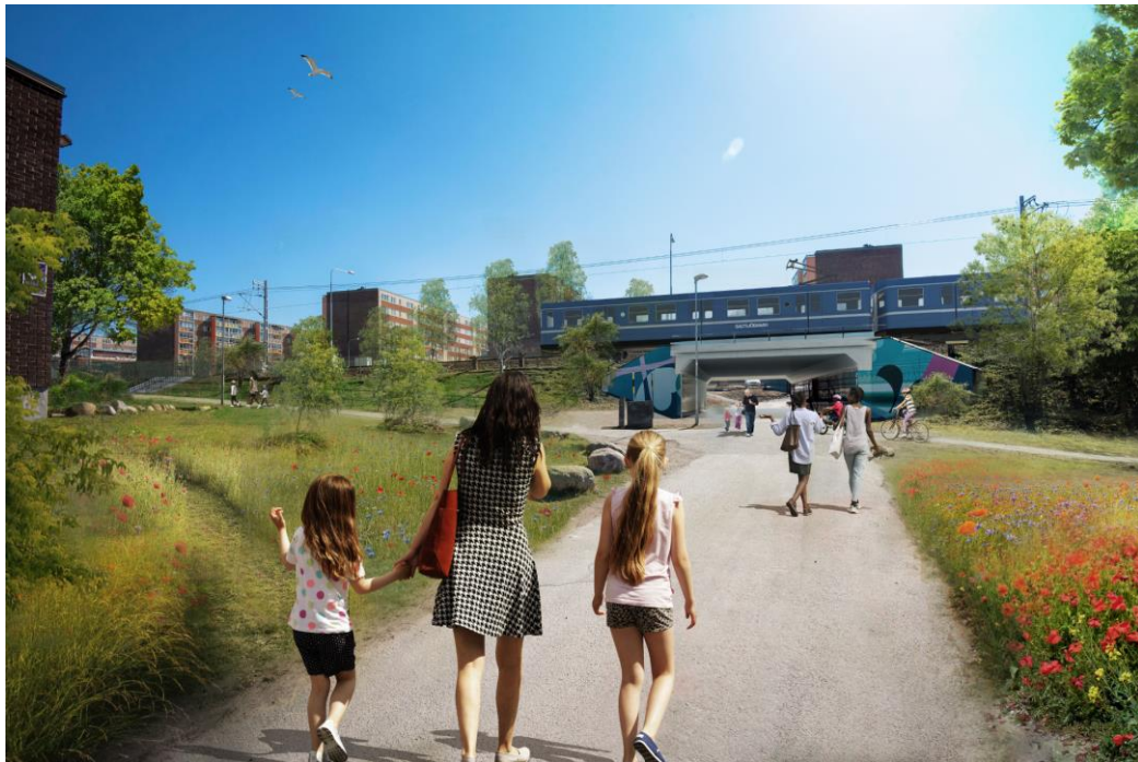
Figur 13. Gång- och cykeltunneln förlängs, vy från norr. Visualisering av Sweco.