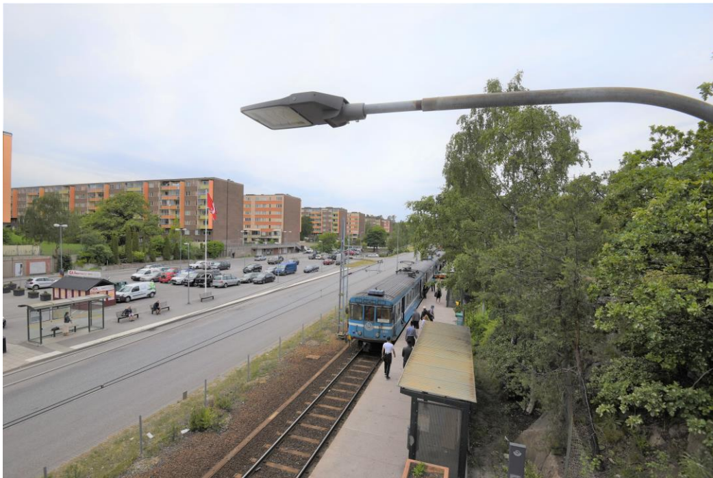
Figur 5. Fisksätra station sedd från gång- och cykelbron över Fisksättravägen. Bostadshusen i Fisksätra syns i bakgrunden.