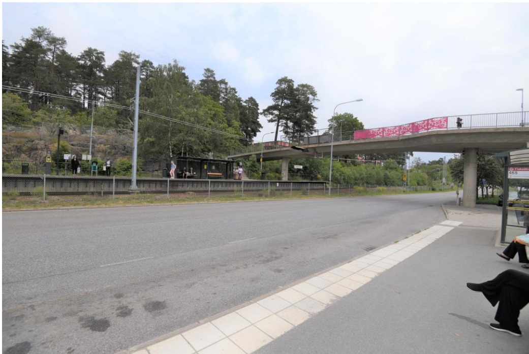
Figur 3. Plattform, spår, Fisksätravägen och gång- och cykelbro över Fisksätravägen.