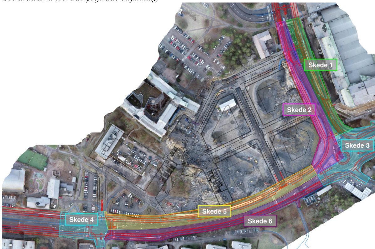
Skedesplanering för produktion av Värmdövägen, etapp 3.