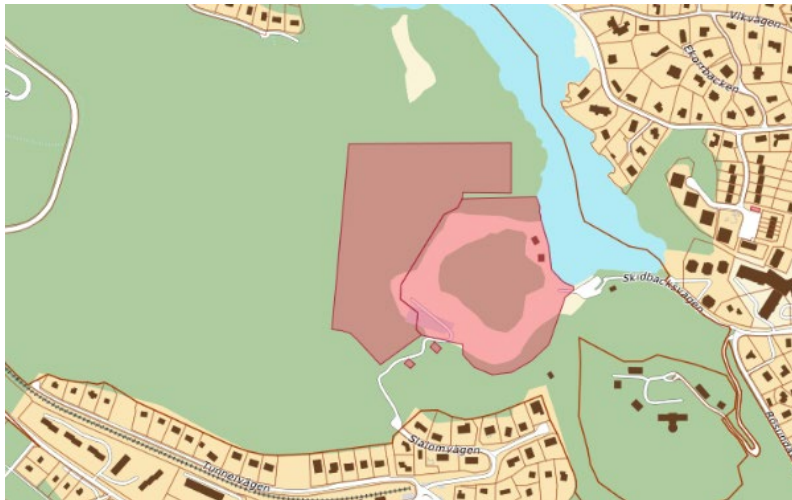
Röda områden visar cykelklubben slalomklubbens befintliga arrendeområden.

Nacka kommun har tidigare arrenderat ut del av fastigheten Tattby 2:19 till Saltsjöbadens rodelklubb. Arrendet med rodelklubben är uppsagt och kommunen har tagit bort rodelbanan. Saltsjöbaden cykelklubb önskar att ta över del av rodelklubbens före detta arrendeområde för att kunna utöka sin verksamhet.