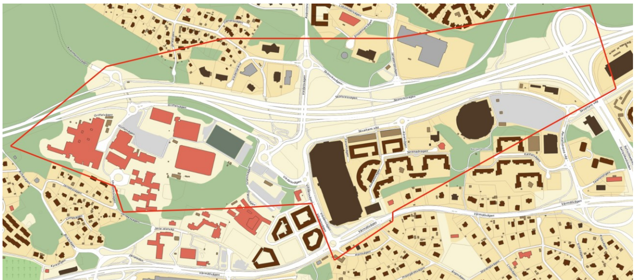
Bild 3. Område som helt eller delvis bedöms påverkas av ny lösning av bytespunkt

I det fortsatta arbetet behöver en konsekvensanalys och ny strukturplan tas fram för delar av Centrala Nacka i takt med att alternativa förslag på bytespunkt utreds och vidareutvecklas. Det berörda området innehåller i första hand projektområdet för Mötesplats Nacka, Järlahöjden, Parkkvarteren, Stadshusparken samt Vikdalsvägen och nuvarande busstorg söder om Nacka Forum, se bild 3.