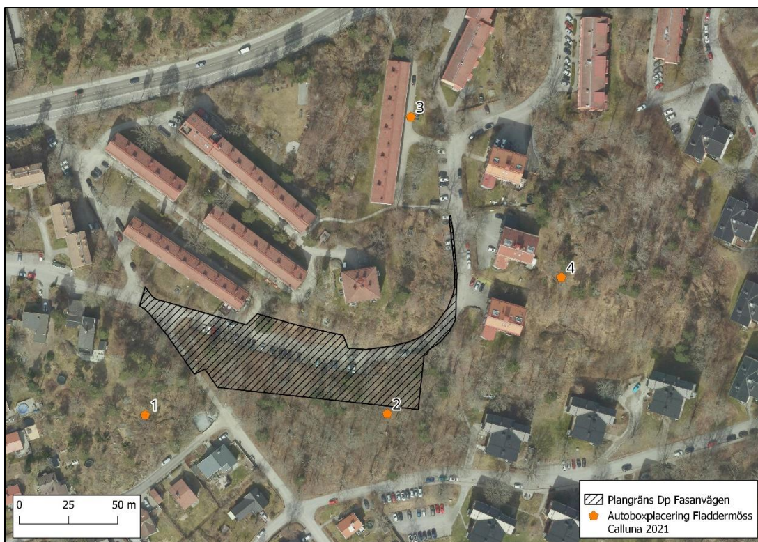
Figur 2. Placering av autoboxar vid fladdermusinventeringen, Calluna 2021.