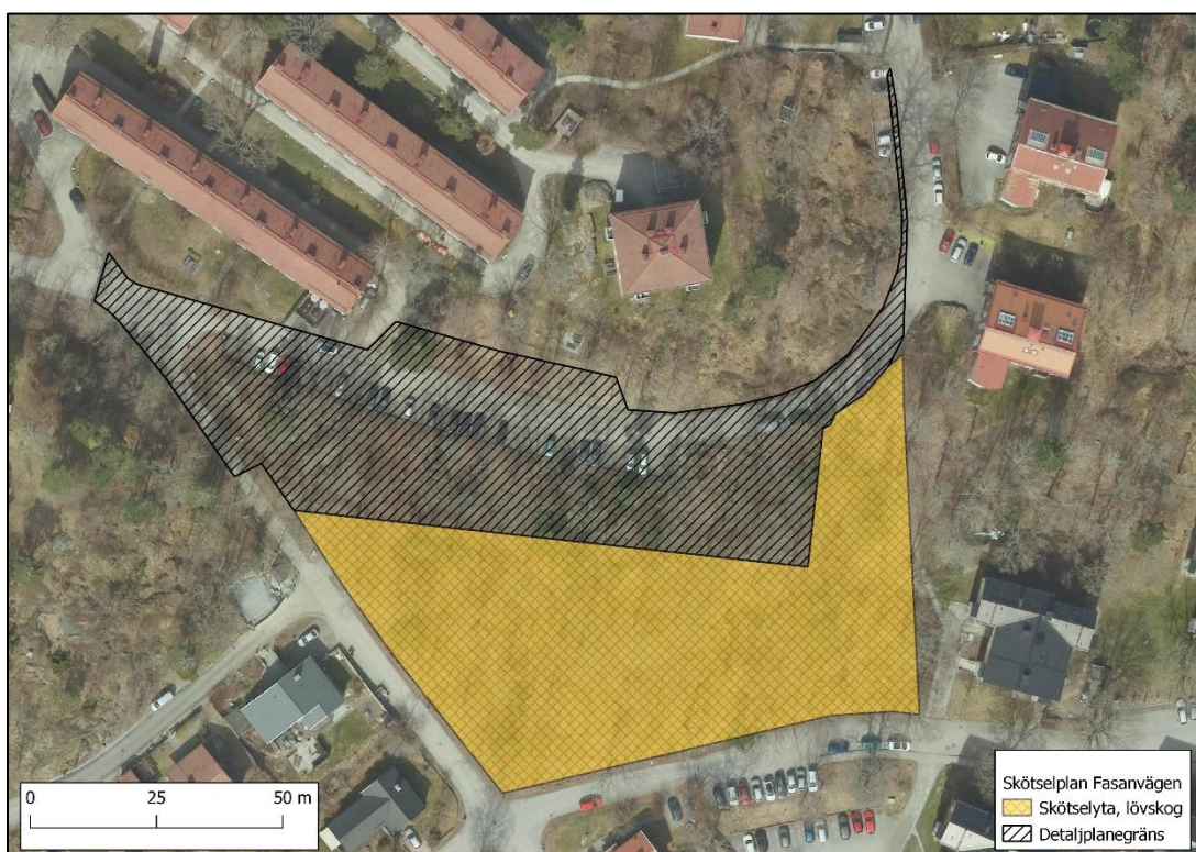
Figur 3. Skötselyta på fastigheten Sicklaön 238:1.