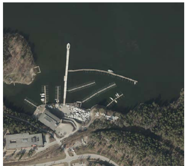
Flygfoto över marinan från 2012 och 2014. Under 2013 byggdes en pir på fastigheten.