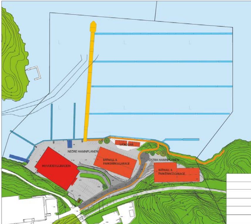
Situationsplan för Fisksätra marina. Bild: Kampmann arkitekter.