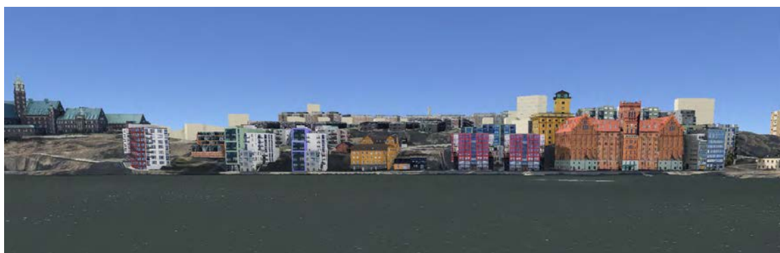
3D-vy över programförslaget, vy från Stockholms inlopp

Hela programområdet är beläget inom riksintresseområde för kulturmiljövården – Stockholms farled och inlopp. För att säkerställa riksintresset bör all bebyggelse som påverkar farledsmiljön utformas med en hög ambition i gestaltning och kvalitet. Detta bör säkerställas i kommande markanvisningar och detaljplanearbeten.