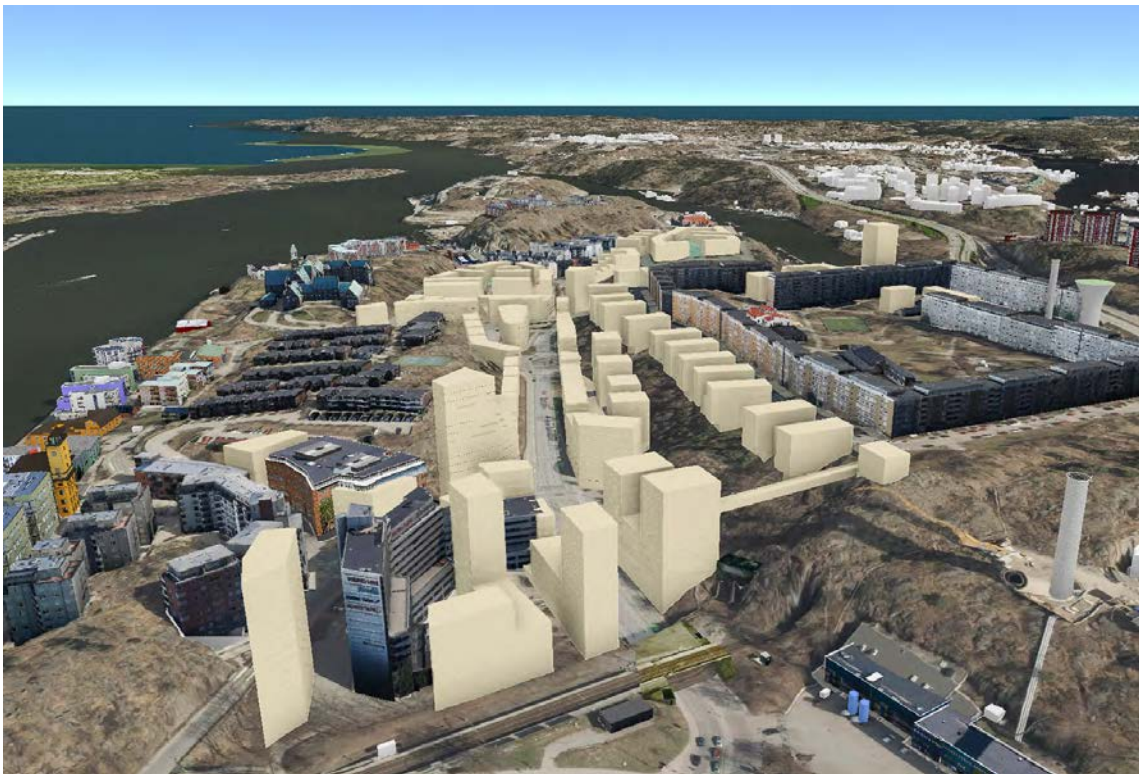
3D-vy över programområdet, vy från väst. Befintlig bebyggelse i mörk kulör och föreslagen i ljus kulör

Då landskapet är dramatiskt bör bebyggelsen i stor utsträckning anpassas till terrängen och gestaltas väl i stadsbilden. Runt Henriksdalstorget utvecklas ny bebyggelse som främst inrymmer bostäder. Programförslaget anger även att ett nytt bostadsområde med nya stadskvarter utvecklas på Henriksdalsberget. Bostadsbebyggelsen föreslås hålla en skala om cirka 4-7 våningar som underordnar sig Henriksdalsbergets karaktäristiska siluett. I den mån det är möjligt bör nya kvarter i stor utsträckning följa terrängen och trappa sig ner mot Kvarnholmsvägen. Ett av de högre husen föreslås placeras i direkt anslutning till Danvikcenter vid Värmdövägen, vilket förstärker entrén till Henriksdal. En högre byggnad föreslås även vid det utvecklade Henriksdalstorget och markerar där entrén till bostadsområdet.