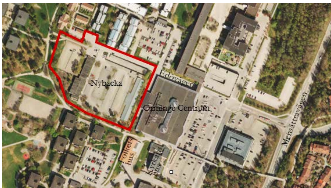
Flygbild del av centrala Orminge med planområdets avgränsning inlagd.

Orminge bedöms som ett bebyggelseområde med arkitektoniska värden med ett lokalt intresse för kulturmiljövård.