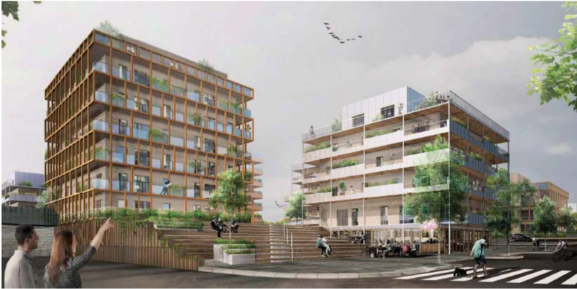
Vy från Edövägen med trapp- och rampförbindelsen sedd öster ifrån. Dinell Johansson Arkitekter