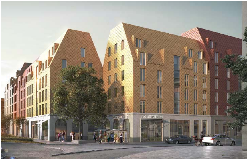
Figur 3 Illustration Brunnberg & Forsbed: exempel på hur fasader kan utformas, kvarter Hantverksbuset, vy från nordöst

Kvarter Utövågen föreslås som ett slutet kvarter kring en gård som öppnar upp mot intilliggande park och anpassas till topografin.