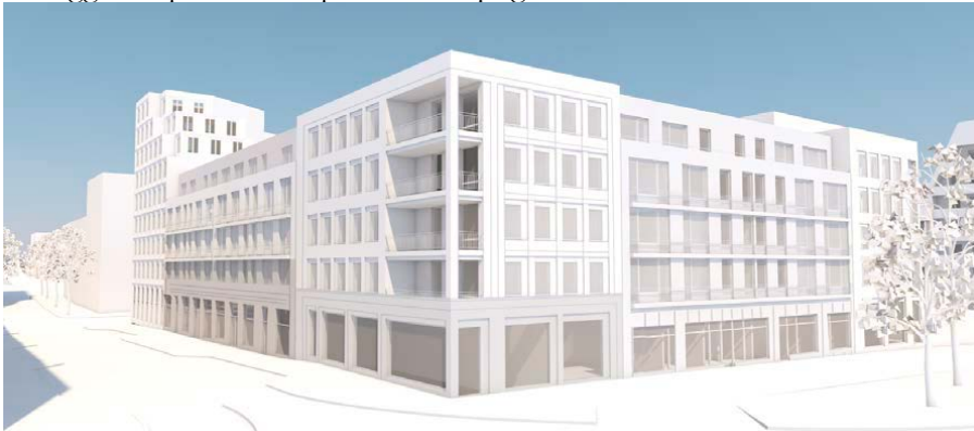
Figur 4 Preliminär volymskiss kvarter Utövågen, vy från sydöst vid korsning Mensättravågen/Utövågens förlängning

Kvarter Utövågen föreslås som ett slutet kvarter kring en gård som öppnar upp mot intilliggande park och anpassas till topografin.