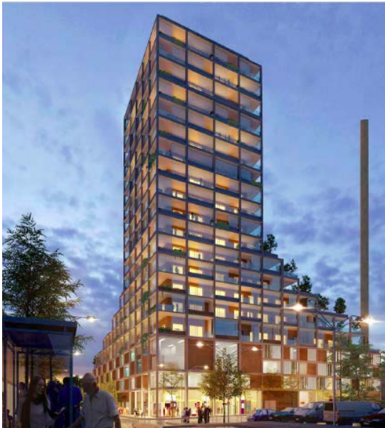
Figur 5 Illustration Kirsch & Dereka: Kvarter Parkeringshuset och intilliggande panncentral, vy från söder Exempel på hur fasad kan gestaltas, parkeringshus med handel och bostäder