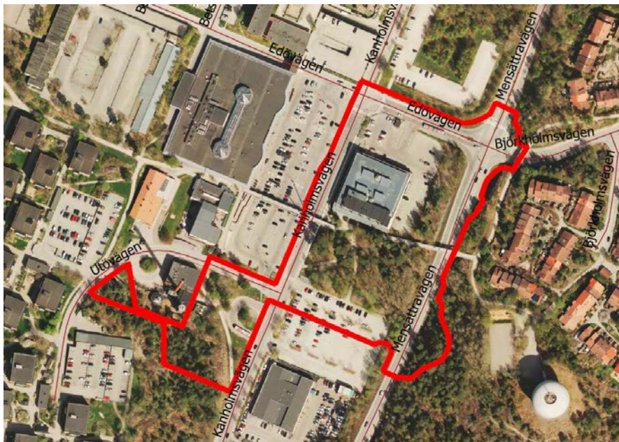
Ortofotot visar det aktuella planområdet inom röd markering.