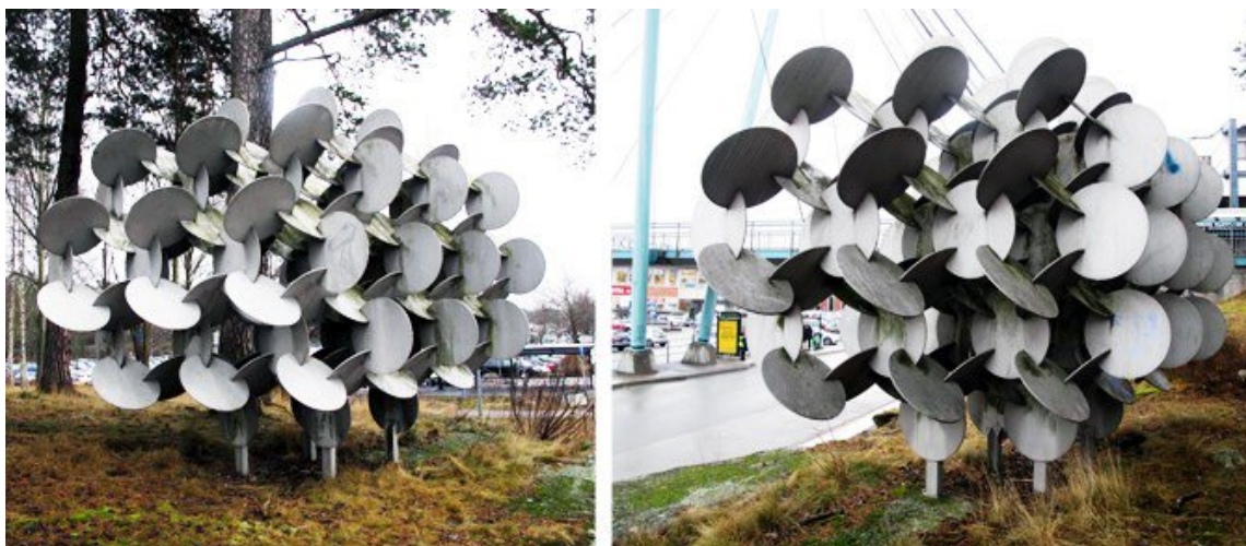
Tredje delen av Helheten är placerat vid Orminge centrum.