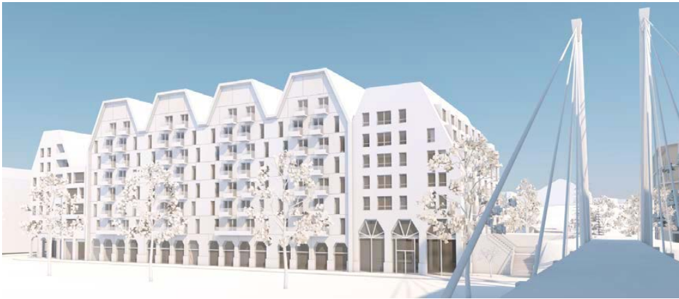
Figur 1 Preliminär volymskiss Kvarter Hantverksbuset, vy från väst vid bron över Kanholmsvägen

Den del av byggnaden som vetter mot Kanholmsvägen har fyra gavelmotiv mot gatan och taklandskapet hjälper därmed till att bryta ner skalan på den kvartersstora volymen som angränsar till Ormingeplans öppna yta.