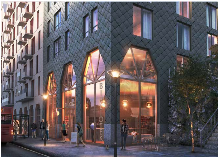
Figur 2 Illustration Brunnberg & Forsbed: Exempel på hur sockelvåning kan gestaltas, kvarter Hantverksbuset, vy från Kanholmsvägen