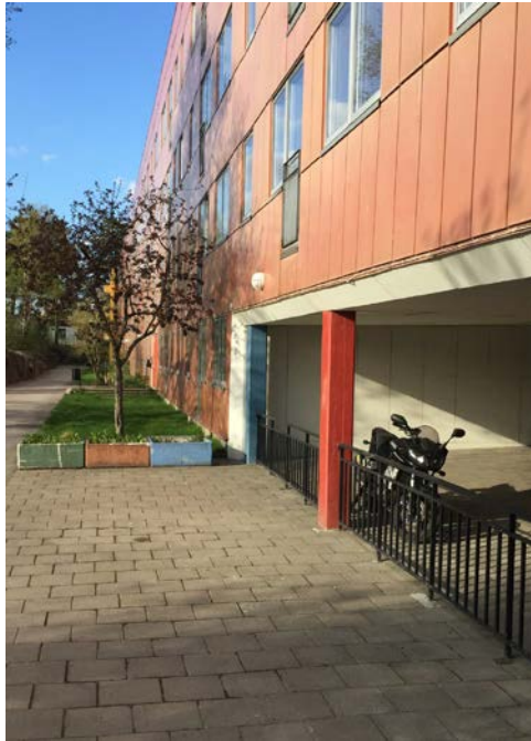
Röda längan idag