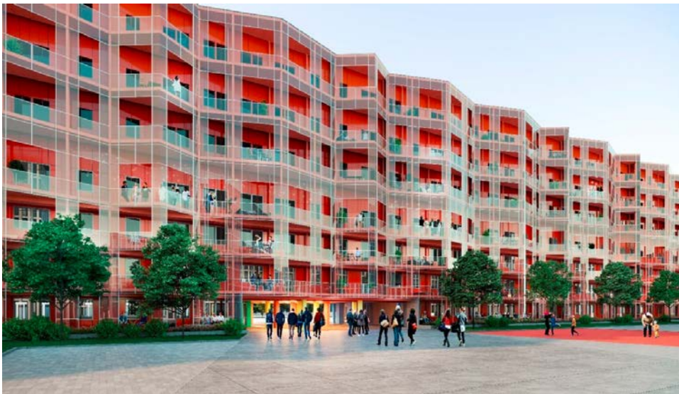
Illustration Wingårdhs: föreslagen tillbyggnad och exempel på hur fasader kan gestaltas, Röda längan, vy från nordväst

Röda torget utvecklas i planförslaget till ett tydligare och mer attraktivt offentligt rum. En allmän lekplats planeras på torget för att tillgodose barns behov av lek och utevistelse. Röda torgets utformning ska vidare utredas till granskningsskedet av detaljplanen.