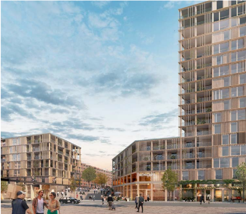
Illustration White arkitekter: föreslagna byggnadsvolymer och exempel på hur fasader kan gestaltas, kvarter Röda trappan, vy från söder

Den befintliga byggnaden Röda längan föreslås byggas på med 3 våningsplan för bostäder samt en halv våning för teknikutrymmen. Vidare föreslås byggnaden som helhet föras med balkonger som veckas för att bryta ner skalans på fasaden. Förslaget innebär cirka 55 tillkommande bostäder. För Röda längan föreslås en gestaltning där det nya och det gamla bildar en ny helhet och där den ursprungliga byggnaden utgör en tydligt avläsbar kärna. Balkongerna föreslås kläs in i ett enhetligt veckat glasskikt som ger fasaderna till den befintliga och nya delen av byggnaden ett sammanhållande yttre skikt. Enligt förslaget bevaras byggnadens befintliga plåtkassetter och tillbyggnaden ska även utföras med plåtkassetter som ska skilja sig jämt mot befintliga i kulör eller utformning, enligt bestämmelse på plankarta.