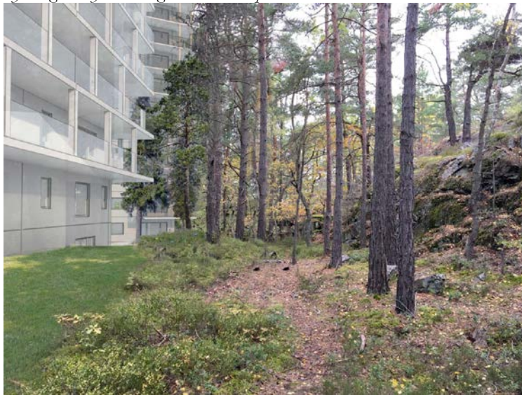
Fotomontage som redovisar bebyggelsen sedd från buffertzonen mot omgivande skog.