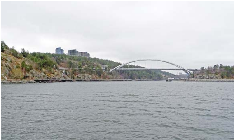
Fotomontage som redovisar den föreslagna bebyggelsen sedd från farleden in mot Stockholm.