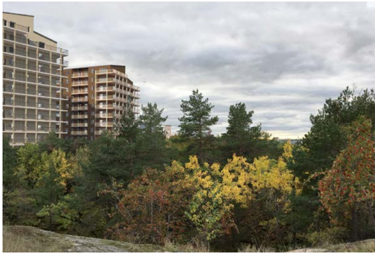
Fotomontage som redovisar den föreslagna bebyggelsen sedd från en av utsiktsplatserna i Ryssbergen. Vy i riktning mot Gullmarsplan och Sickla.

Sockelvåning mot allmän plats ska vara tydligt markerad samt utformas med särskild omsorg beträffande gestaltning och arkitektonisk kvalitet så att den bidrar till en varierad stadsmiljö. Bebyggelsen ska utformas med varierade gatufasader. De gatufasader som inte utgörs av byggnadernas kortsidor eller gavlar ska utformas så att fasaden upplevs bestå av minst två sammansatta hus. Fasadutformningen samt bebyggelsens detaljering och material kommer att studeras vidare till detaljplanens granskningskede.