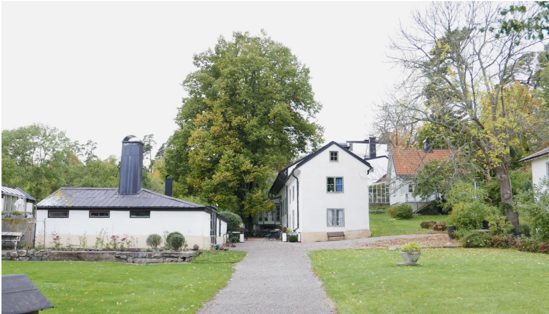
Bilden visar gårdsmiljön sett från Strandpromenaden där kafé/restaurangbyggnaden ligger längst till vänster i bild.