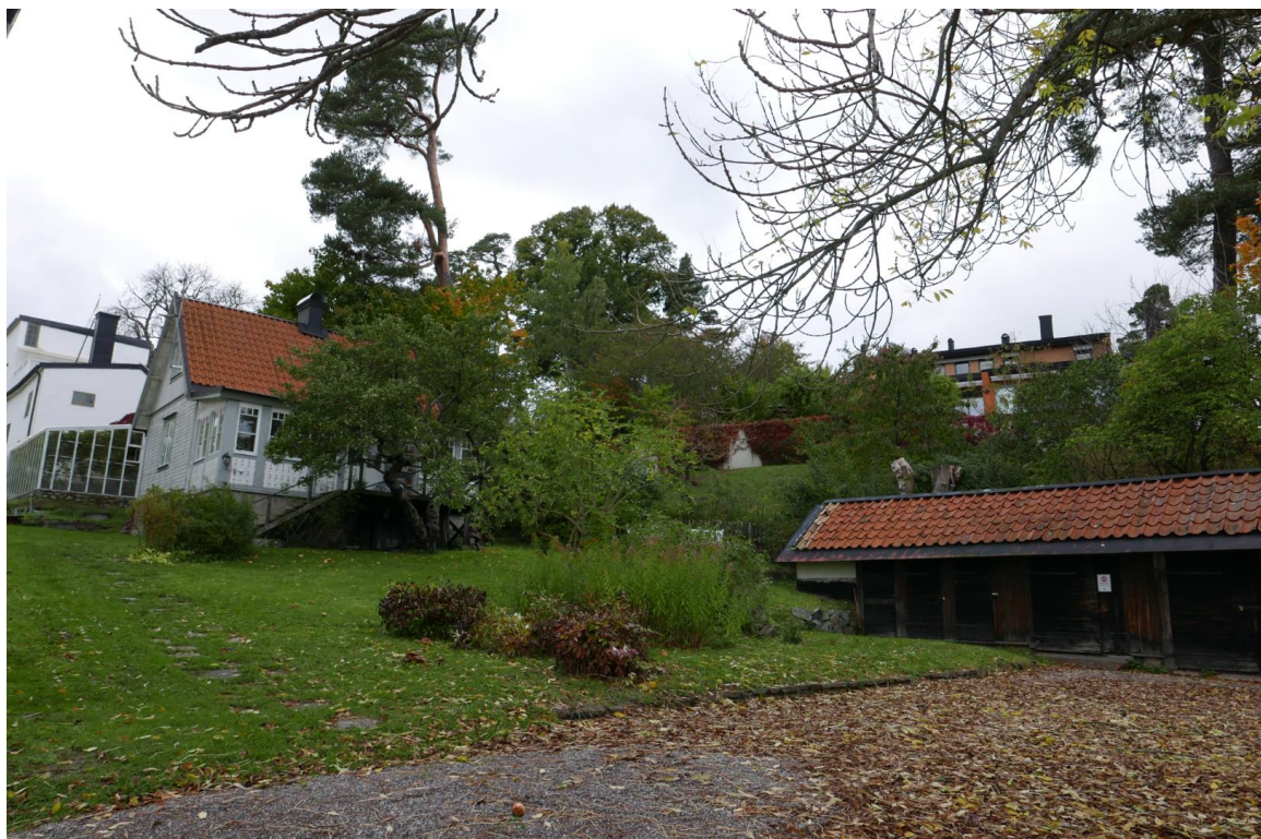
Till vänster ses kuskbostaden på en höjd. Till höger ses uthuset.

Kuskbostaden med tillhörande förrådsbyggnad är en del av gårdsmiljön och därmed särskilt värdefulla. De föreslås få ett utökad skydd och får inte förvanskas. Det är viktigt att samtliga byggnader som ingår i gårdens sammanhang säkerställs.