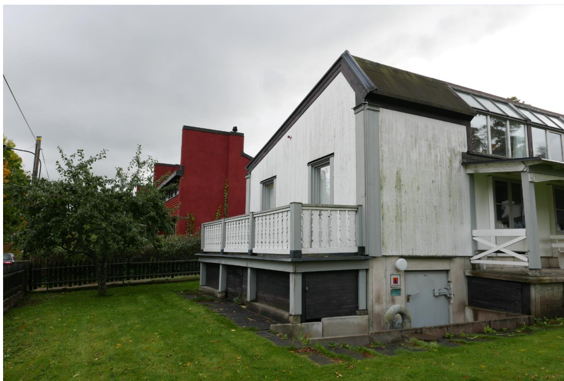
Bilden visar den befintliga balkongen på nya ateljén.

På nya ateljéns östra gavel föreslås en tillbyggnad där det idag finns en befintlig balkong. Balkongen utnyttjas inte och fönsterna är igenbommade från insidan. Istället för att ha en uthängande balkong byggs utrymmet in för att möjliggöra utökade utställningsytor. För att kunna avläsa befintlig byggnad ska tillbyggnaden underordna sig den befintliga arkitekturen och ta hänsyn till den befintliga byggnadens symmetri. Tillbyggnaden ska utformas så att insyn inte kan ske från söder.