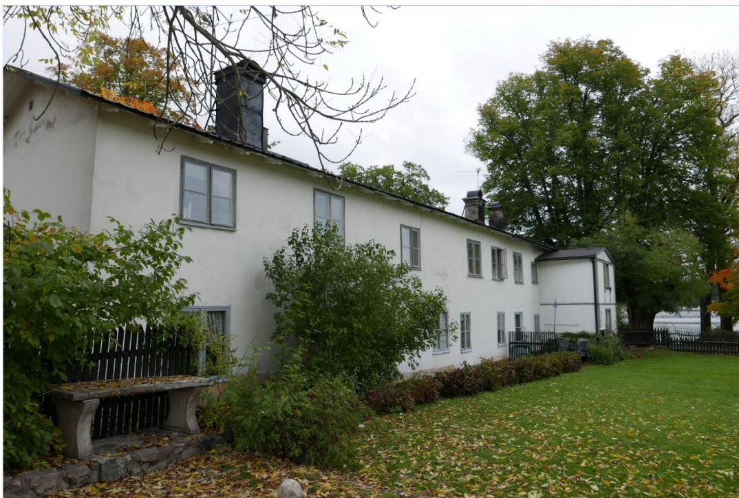
Bilden visar Långa radens södra fasad.