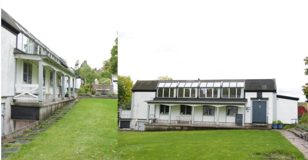
Bilden till vänster visar nya ateljéns fasad i förgrunden och gamla ateljén i bakgrunden. Bilden till höger visar nya ateljén.