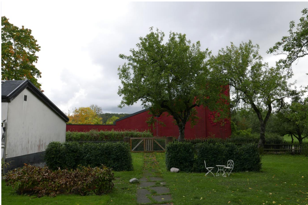
Bilden visar gaveln till gamla ateljén. Till höger om den stenbelagda gången föreslås komplementbyggnaden uppföras.

En komplementbyggnad kopplad till verksamheten föreslås uppföras väster om gamla ateljén. Komplementbyggnaden avser användas för personalutrymmen med ingång vänd mot gamla ateljén. Byggnaden ska utgöra ett insynsskydd mot grannfastigheterna. Fasaden ska vara sluten mot innergården och mot grannar i söder.