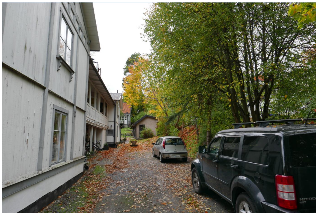
Parkering och angöring till Långa raden sker via infart från Strandpromenaden. Långa radens norra fasad ses på bilden.

Angöring till Långa raden sker norr om byggnaden, via infart från Strandpromenaden. Parkeringsplatser ska anordnas inom den egna fastigheten, vilket löses norr om byggnaden. För att lösa angöring till Kuskbostaden kan det bli aktuellt med upprättande av servitut. Resterande byggnader inom planområdet angörs via befintliga entréer i söder och öster. Parkeringsplatser finns på motsvarande sida Strandpromenaden.