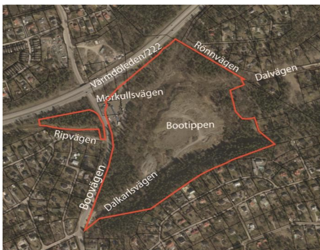
Bild 1. Kartan visar ett flygfoto med fastighetsindelning över planområdet (röd markering) med omnejd.

Kommunen har för avsikt att markanvisa kommunal mark. Inför antagande av detaljplan kommer genomförande- och marköverlåtelseavtal att tecknas med exploatörerna.