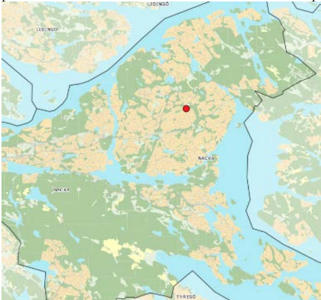
Områdets placering i kommunen.

Miljö- och stadsbyggnadsnämnden har, i enlighet med 5 kap. 5 § PBL, prövat begäran om planbesked och har därför inte för avsikt att inleda planarbete för rubricerade fastigheter.