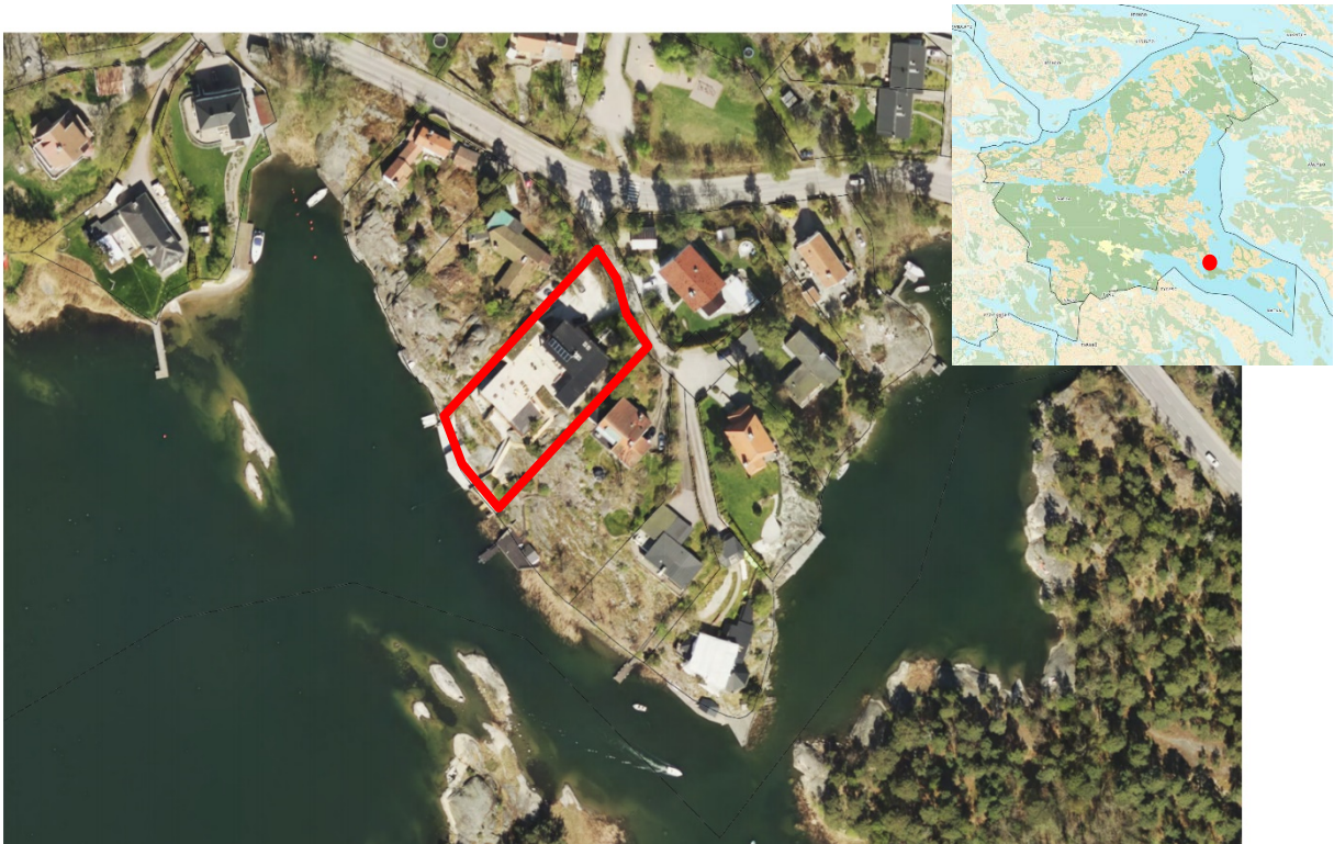
Aktuell fastighet markerat med rött

Debitering av planbeskedet sker enligt miljö- och stadsbyggnadsnämndens taxa. Faktura skickas separat.