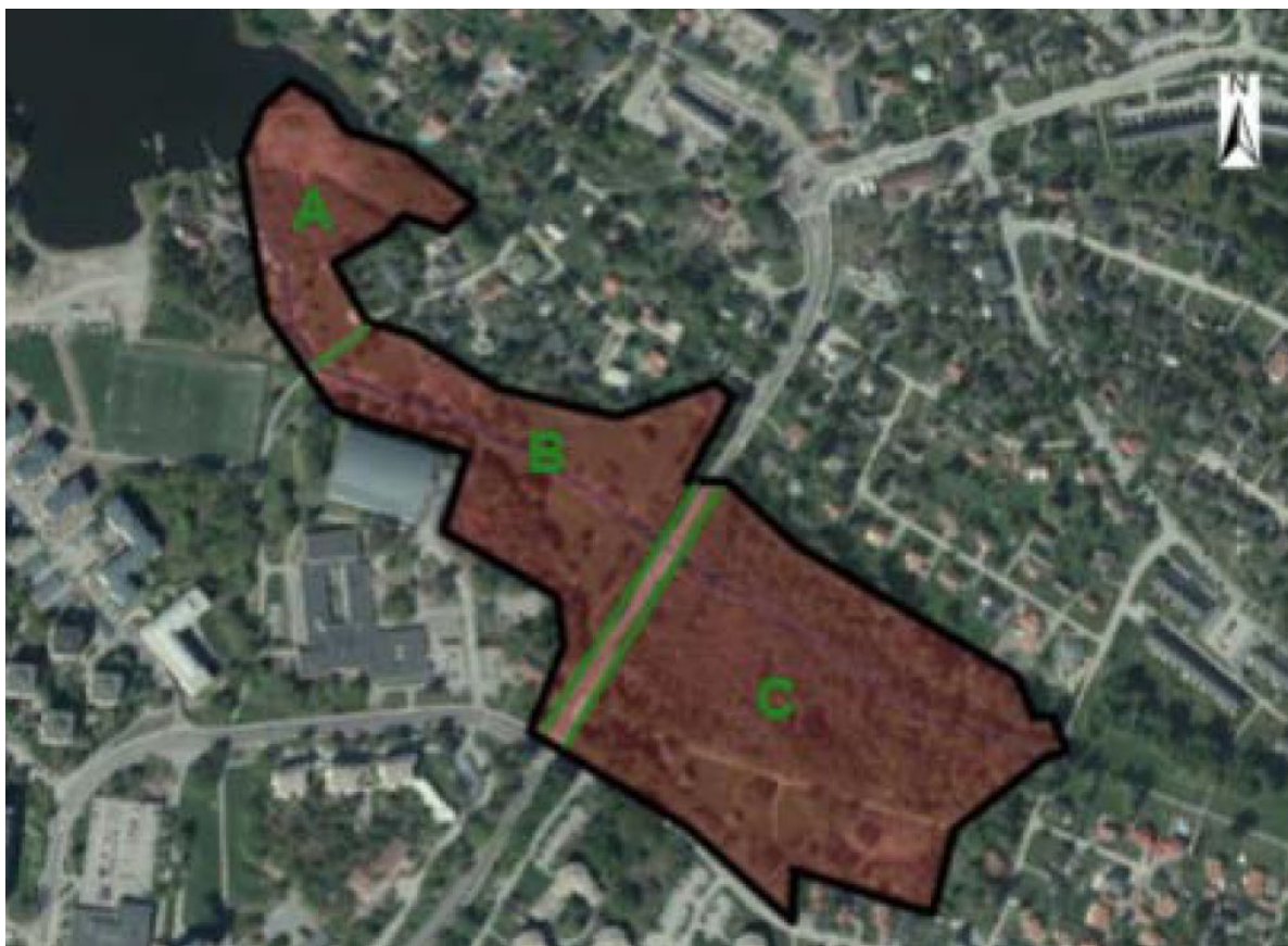
Områdesfördelning enligt medborgarförslaget