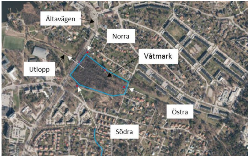
Bild från Älta våtmarksutredning som WRS tog fram 2018. Inringat område visar våtmarksområdet.

Drygt 50% av vattentillflödet till våtmarken utgörs av inströmmande grundvatten. Det är därför vattnet är så klart och vattennivåerna så stabila. Dagvattnet i området späds alltså ut. För att fylla sin funktion, rekommenderas att våtmarkens yta (se figur ur rapporten nedan) bevaras obebyggd som ett naturområde för att bibehålla naturvärdet samt vattenreglerande och renande funktioner. Enligt utredningen behöver inte våtmarken utvidgas till området väster om Ältavägen – område B, då den är tillräckligt stor i dag.