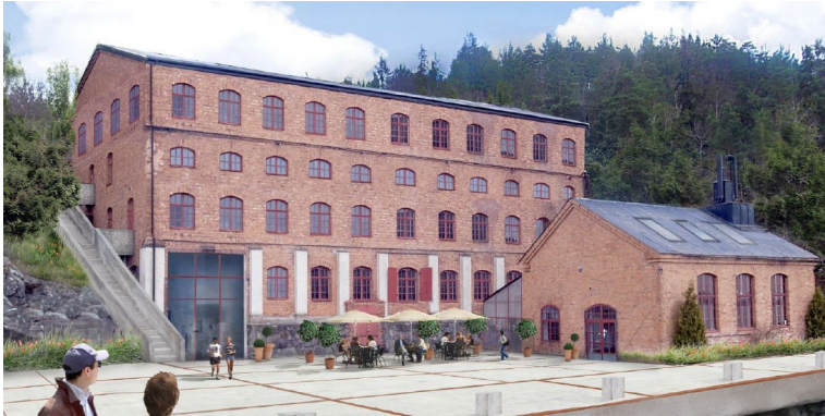
Illustration som visar förslag till påbyggnad med en våning av befintlig byggnad. (Ahlqvist & Almqvist arkitekter AB).

I samband med områdets utbyggnad ska stödmuren för vägen som är belägen väster om den äldre byggnaden ges en gestaltning som gör att den bättre införlivas i den omgivande miljön samt stärker riksintresset norra kusten.