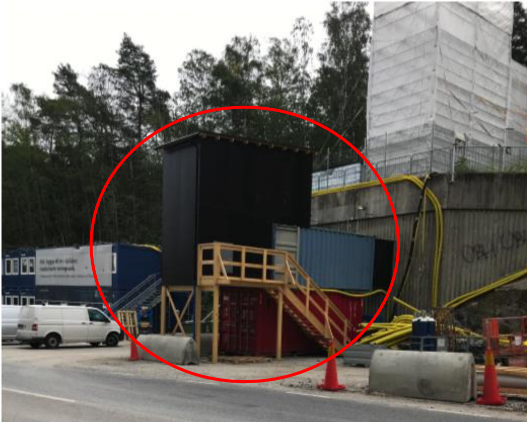
Bild på aggregatet inskickad i samband med lovansökan den 2019-11-06.

Detta innebär att det har skett en överträdelse av plan- och bygglagen. Eftersom rättelse inte har gjorts ska en byggsanktionsavgift tas ut.