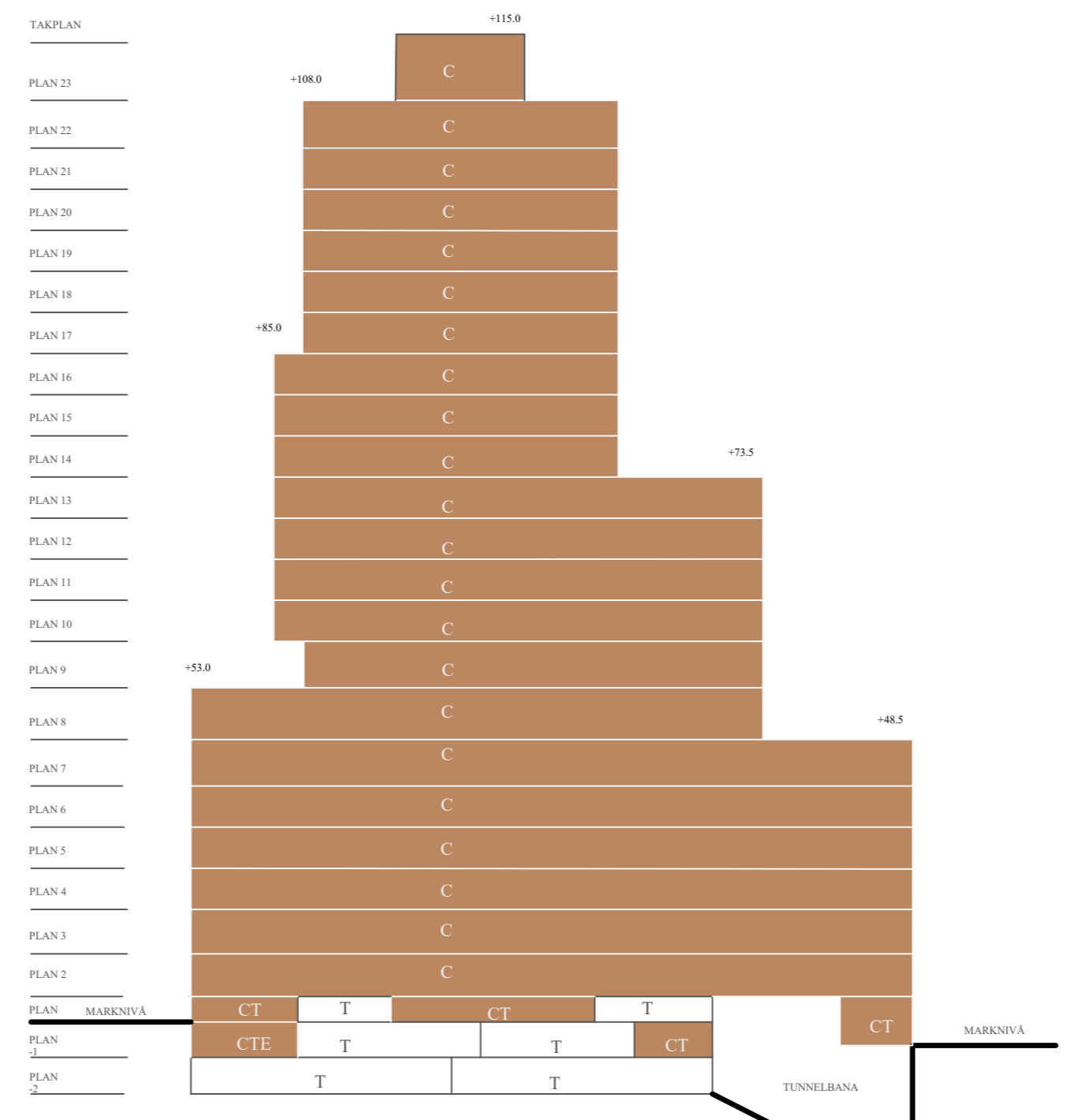
Illustration - Sektion av fasad mot Smedjegatan. Användningen av kvartersmark regleras inte per våningsplan. Illustrationen visar ett exempel på utformning.

Grundkarta: Sickla stationshus exploatering Koordinatsystem: SWEREF 99 1800 Höjdsystem: RH2000 Sporrtid: 2020-05-06 Reviderat: 2020-10-05 Grundkartan upprättad genom utdrag och komplettering av kommunens primärkarta. Fastighetsindelningen i kartan har inte ritats över, genom rötter och tvärväggarna.