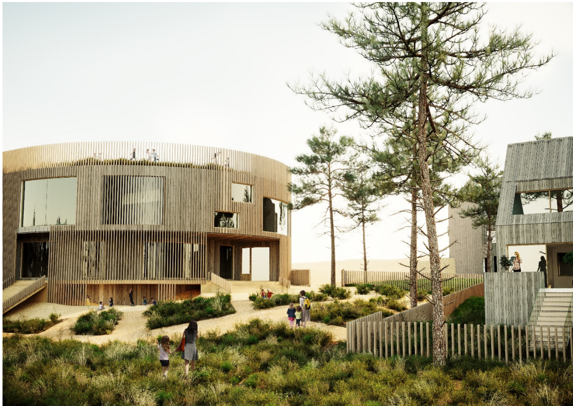
Perspektivbild över möjlig utformning på förskolan (till vänster) och radhusen (till höger). Vyn är tagen från norr och i förgrunden syns en möjlig utformning på förskolegården. Illustration: Gisselberg Arkitekter

Planförslaget innehåller även en ny förskola med plats för 160 barn i 8 avdelningar och föreslås drivas i privat regi. Norra delen av planområdet föreslås användas som förskolegård, med cirka 24 kvadratmeter gårdsyta per barn. Förskolebyggnadens gestaltning föreslås ha fasader i huvudsak av trä, och ges förslagsvis en rundad form i kontrast till radhusens rakare linjer. Inom kvartersmarken föreslås även en lekyta och trädplanteringar. Gatorna inne i bostadsområdet föreslås utgöras av kvartersmark. En kommunal gång- och cykelbana planeras på allmän plats inom planområdet längs Ormingeringen.