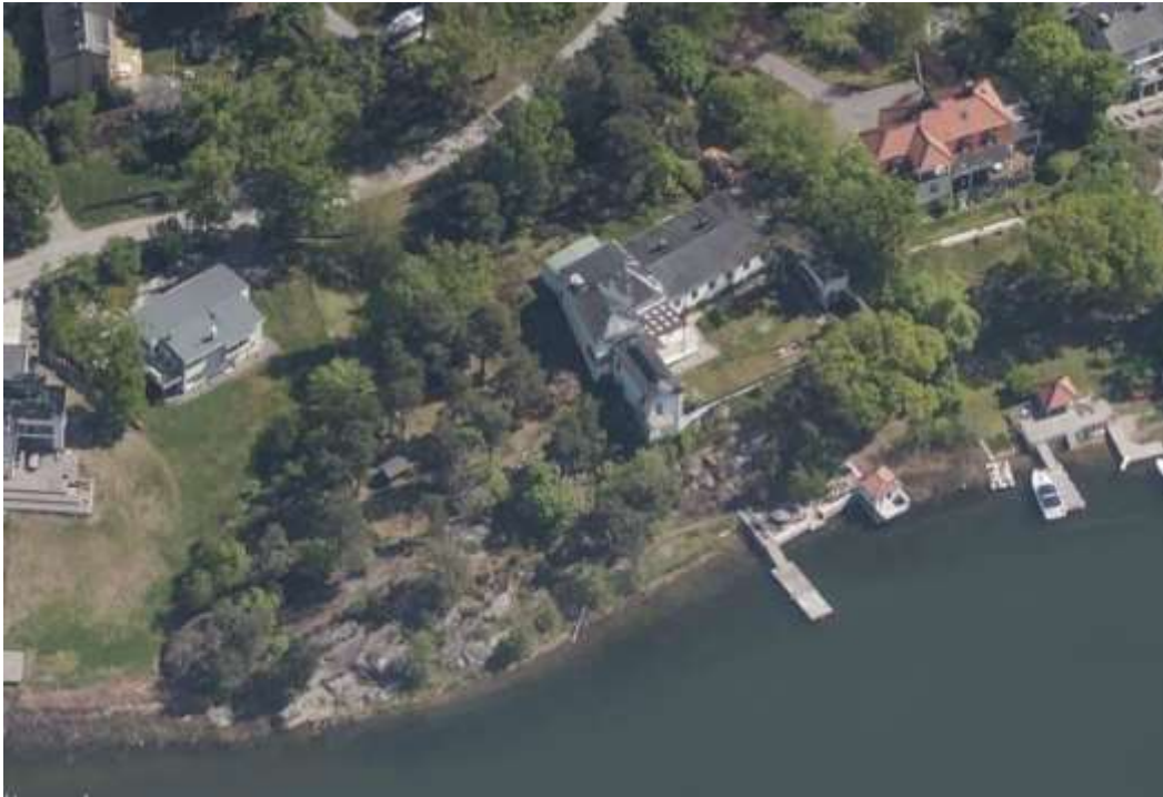
Flygvy från väster.

Enligt de områdesvisa riktlinjerna i översiktsplan för Nacka från 2018, anges berört område utgöra gles blandad bebyggelse. Området är av lokalt intresse för kulturmiljövården som anger stora tomter med individuellt placerade villor. Fastigheten omfattas av Stadsplan 88 som vann laga kraft 25 oktober 1912 och Stadsplan 113 som vann laga kraft 21 augusti 1936.