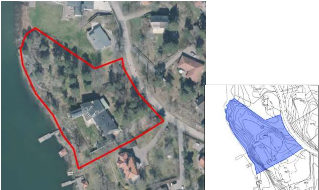
Fastigheten Solsidan 46:5 markerad.

Den aktuella fastigheten Solsidan 46:5 är belägen i Solsidan, inom ett område med friliggande villor. Fastigheten är 6040 kvadratmeter och bebyggd med en högt placerad huvudbyggnad med en byggnadsarea på cirka 520 kvadratmeter samt några komplementbyggnader placerade dels vid en brygganläggning (utanför fastigheten), dels norr om huvudbyggnaden. Tomten är kuperad med en kraftigt sluttande förkastningsbrant mot Vårgårdssjön i väster. Höjdskillnaden är cirka 12 meter. Tomten har till stor del karaktären av en naturtomt dominerad av barrträd, lövträd och hällar.