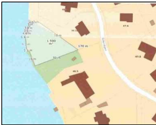
Sökandes förslag till avstyckning, markerat i ljusgrön färg.

Planenheten mottog den 16 september en begäran om planbesked för fastigheten Solsidan 46:5. Sökandena önskar avstycka fastigheten vilken köptes 2017. Föreslagen markanvändning är bostäder. Sökande föreslår att den avstyckade delen av fastigheten blir cirka 1500 kvadratmeter. Skäl som framförs för ett positivt planbesked är att fastigheten är alltför stor för en modern familjs behov och skiljer sig avsevärt från övriga fastigheter i området. För att befintlig byggnad ska rymmas inom gällande planbestämmelse om att högst en tiondel av fastigheten får bebyggas, föreslår de att del av byggnaden rivs om inte annan lösning är möjlig.