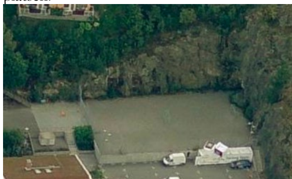
Flygbild från år 2006.

Det krävs bygglov för att anordna, inrätta, uppföra, flytta eller väsentligt ändra en idrottsplats. Flygbilderna visar att någon gång mellan åren 2001 och 2003 har det byggts en upphöjd plan för bollspel samt att det monterats belysning och nät kring ytan. Det finns inte något bygglov för varken någon idrottsplats eller för annan åtgärd på den aktuella platsen.