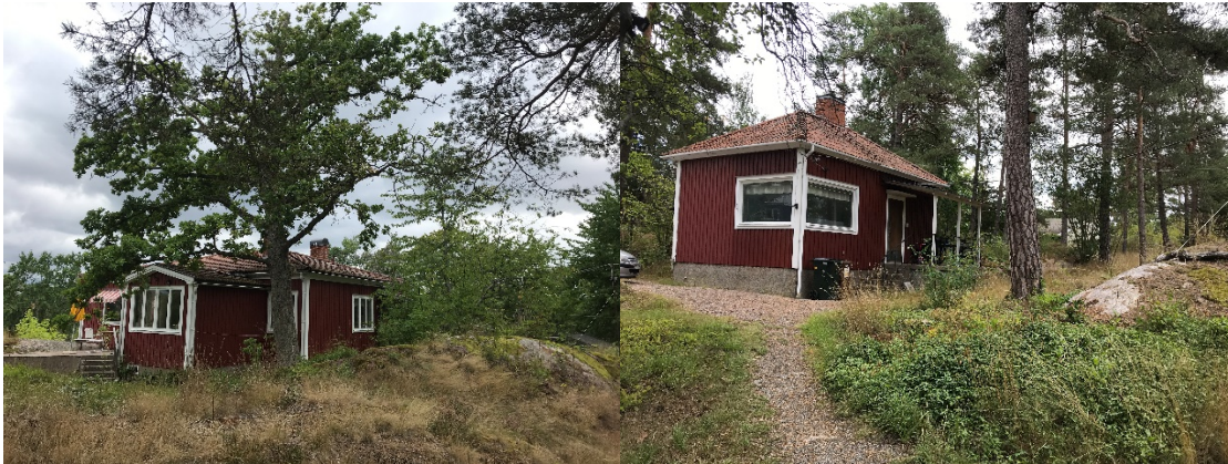
Tv: Huvudbyggnaden på Björknäs 10:124 med bevarandevärd ek intill. Tb: Den mindre byggnaden omgiven av äldre tallar

Vad gäller byggnaderna på fastigheterna Björknäs 10:123 respektive 10:118, ligger delar av byggnaderna på prickmark (mark som inte får bebyggas) i gällande plan. I det ena fallet beror avvikelsen på bristfällig inventering inför planläggning. I det andra fallet är avvikelsen accepterad som mindre avvikelse enligt PBL vid tidigare bygglovsprövning.