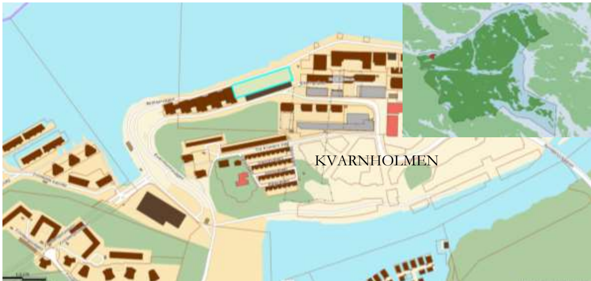
Blå markering visar aktuell fastighet och den lilla kartan markerar läge i kommunen.

Miljö- och stadsbyggnadsnämnden har, i enlighet med 5 kap. 5 § PBL, prövat begäran om planbesked och har därför inte för avsikt att inleda planarbete för fastigheten Sicklaön 38:11.