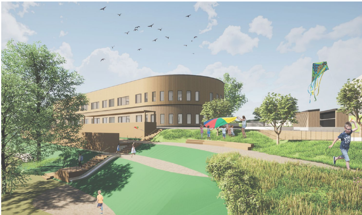
Perspektivbild över möjlig utformning på förskolan. Vyn är tagen från norr och i förgrunden syns en möjlig utformning på förskolegården. Illustration: Sharc

Planförslaget innehåller även en ny förskola med plats för cirka 200 barn. Norra delen av planområdet föreslås användas som förskolegård, med cirka 20 kvadratmeter gårdsyta per barn. Förskolebyggnaden föreslås enligt gestaltungsprogrammet utformas med fasader i huvudsak av trä, och ges förslagsvis en rundad form i kontrast till radhusens rakare linjer.