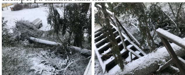
Foton inkomna 22 februari 2022 på tidigare stormfällt träd på intilliggande fastighet Älgö 22:5 vid berörd parkering.

Den 22 februari 2022 inkommer ett mejl och fotografier i lovärendet B 2023-000127 av exempel på träd som har blåst omkull och i vissa fall också skadad egendom och även exempel på riskträd nära hus.