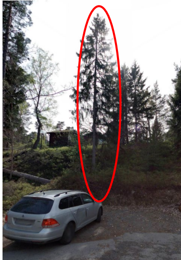
Bild från StreetSmart 9 maj 2019. Berört träd markerat med röd ring.

Av kommunens interna fotomaterial StreetSmart framgår att trädet inte var fällt 9 maj 2019.