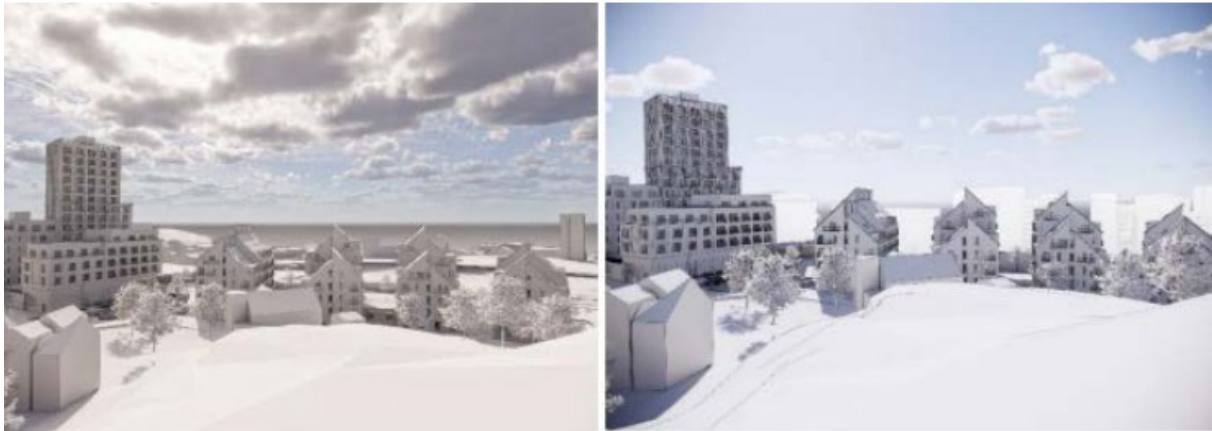
Utsikten från Birkaberget över Järlasjön och Nackareservatet vid genomfört planförslag. Birkaberget är ett omtyckt utflyktsmål för närboende i Birka och Finnorp. Utsikten över Järlasjön blir förändrad men sjön är fortfarande synlig. Bild till vänster: Utsikten vid genomfört planförslag. Bild till höger: Vita byggnader i fonden ingår i strukturplanen men har ingen lagakraftvunnen detaljplan. Bilder: Semrén & Månsson.

Vad gäller detaljplaneprogrammet för centrala Nacka så anger det att Järila-Birkaområdets siluett ska beaktas. Planenheten bedömer att områdets siluett söderut beaktas av förslaget genom att siluetten fortfarande kommer att vara avläsbar söderifrån, genom de öppningar förslaget medger, även om siluetten till viss del skymms.