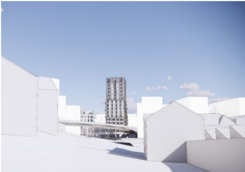
Högdelen sedd från Järta sjö bostadsområde. Bild: Semrén & Månsson, 2021.

Högdelen medför framför allt skugga på omkringliggande allmän plats men skuggar även del av de närmsta fastigheterna norr om Birkavägen. Delar av fastigheten Sicklaön 136:2 skuggas på förmiddagen vår, höst och vinter. Delar av fastigheten Sicklaön 137:14 skuggas mitt på dagen vår, höst och vinter. Fastigheten Sicklaön 137:13 skuggas inte nämnvärt av högdelen. Planenhetens bedömning är att skuggan är en acceptabel konsekvens av att stadsmiljön förtätas och att den inte bedöms medföra betydande olägenhet för de fastigheter som påverkas av den.