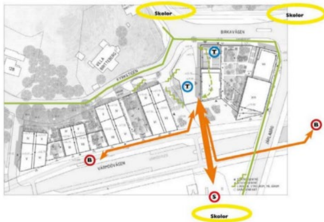
Bilden visar de starkaste gångstråken och målpunkterna inom det framtida Järila Stationsområdet. Orange=starka gångstråk från och till kollektivtrafik, Grön= gångstråk, grön streckad=stråk via buss, grön zick-zack=via trappa

I det östra kvarteret planeras för en hiss som sammanbinder det övre och det nedre torget och som gör tunnelbanan tillgänglig från Birkavägen samt Birkavägen tillgänglig från Värmdövägen. Nattetid är biljetthallen stängd under cirka 4 timmar och då kan den som inte kan använda trappan gå runt den planerade bebyggelsen. Förslaget innebär sammantaget en tillgänglighetsmässig förbättring och ökad trafiksäkerhet för de gående i norr-södergående riktning. Gångtunneln från Järila sjö till Järila Norr under Saltsjöbanan ägs av Region Stockholm. I dagsläget är den inte tillgänglighetsanpassad vilket innebär att närmaste tillgängliga väg till tunnelbanan från Järila sjö sker via Järila gårdsväg, över Järila bro via Birkavägen och den ingång till tunnelbanan som planeras där. Trafiksäkerheten inom planen kommer att säkerställas genom hastighetsdämpande åtgärder vid korsningen Järlaleden/ Birkavägen. Övergångsställena som planeras över Värmdövägen kommer att signalregleras.