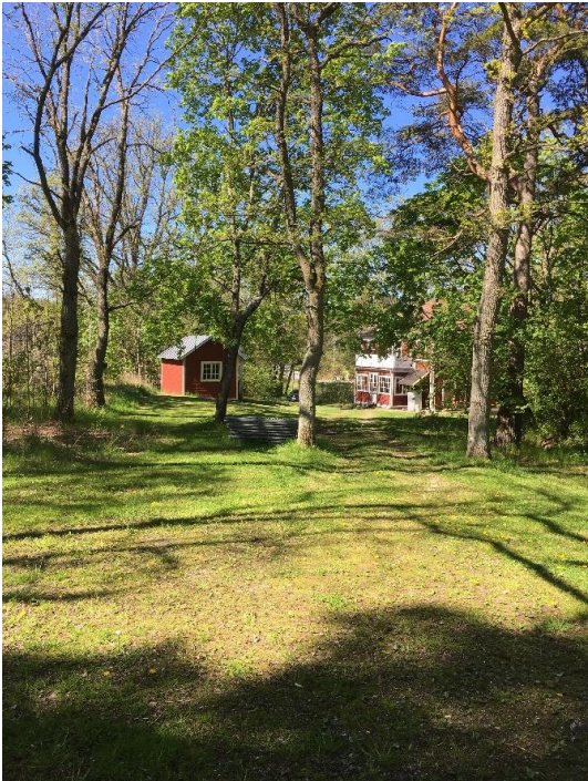
Bild 2: Två av ekarna som är värdefulla samt den lilla stugan som ska rivas.