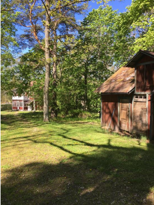
Bild 1: Till vänster i bild syns den befintliga förrådsbyggnaden som ska rivas.

Fotografier från olika vinklar av platsen inklusive omgivningarna med värdefulla ekar där de nya byggnaderna planeras.