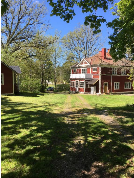
Bild 3: Uppfarten till den planerade bebyggelsen sett från platsen som ska bebyggas