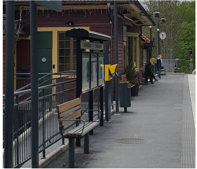
Informationsskylt SLs standard