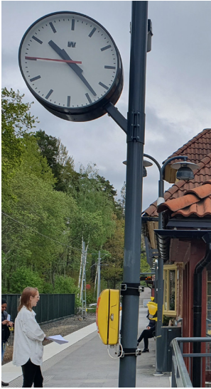
Plattformsur Plattformsur i standardutförande monterad på belysningsstolpe.