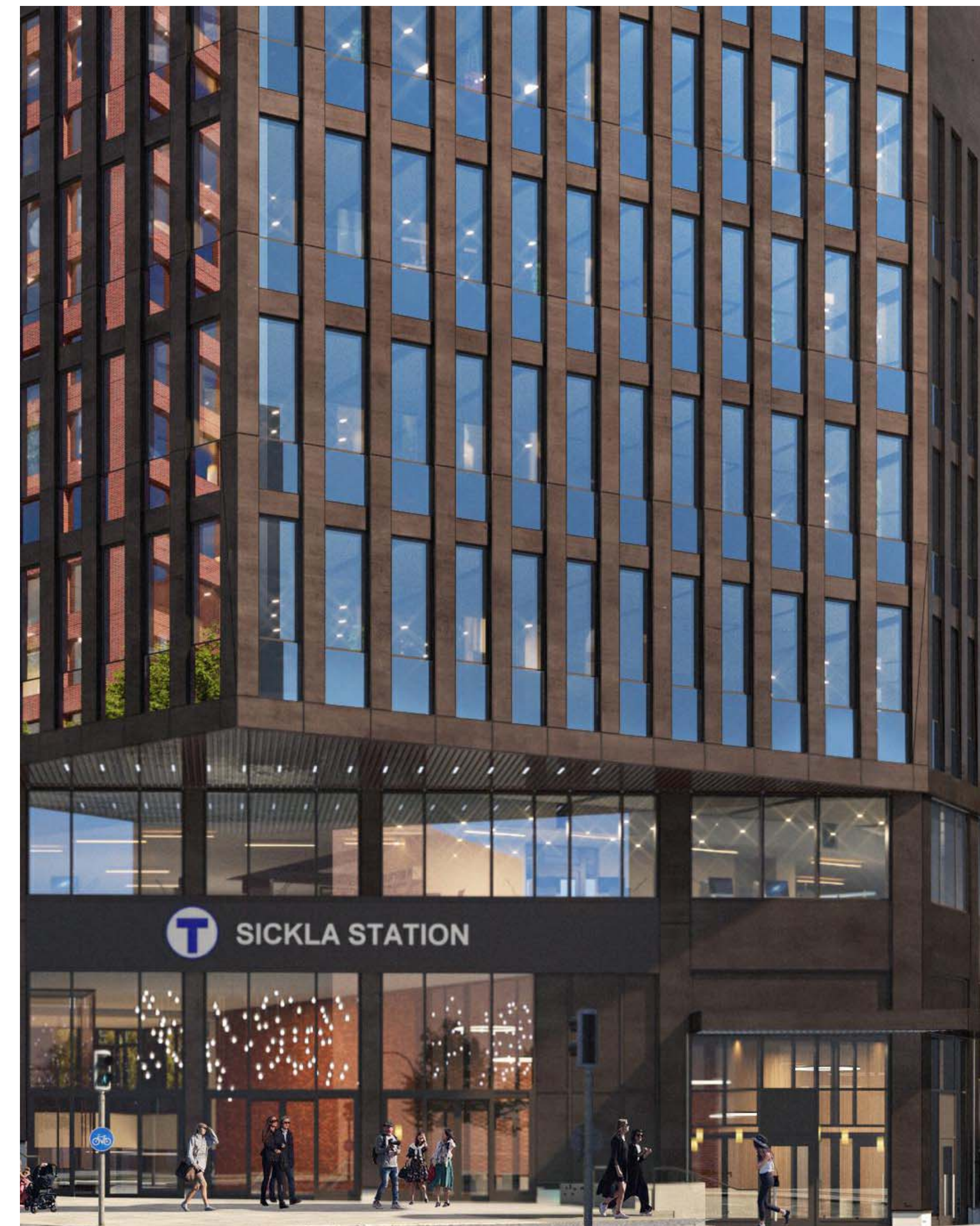
Gestaltning - fasadutsnitt uppglasad bottenvåning och elementfasad