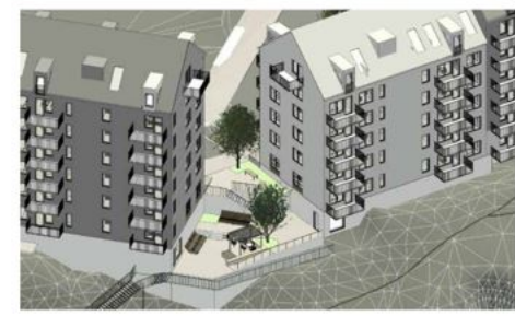
Vänster Vy över norra terrassen. Minitorg och umgänge i flera nivåer med grill och solsoffor. Kontakt och passage både ner till Sicklastråket och till naturmarken w