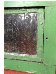
Stuga nr 58, bilden till höger visar fönsterbåge med 200-åriga hörnbeslag.