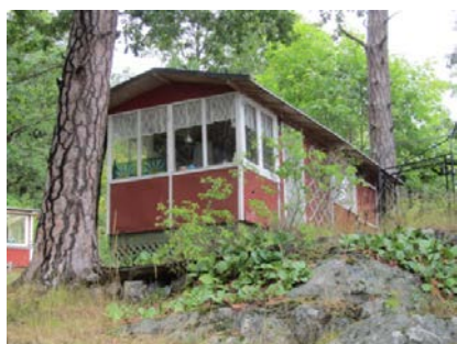
Stuga nr 54.

Stuga nr 54 (+) . Slank, långsmal och outbyggd huskropp. Har en primitiv lätt byggnadskonstruktion på plintgrund med masonitklädda väggar, tunna lister och ett utskjutande sprött sadeltak som är pappklätt (saknar dock vikstugans branta takvinkel). Stugan ger fortfarande ett starkt intryck av enkelt sommarboende. Gaveln är inglasad likt en veranda, påminner om en del stugtyper i Visborgs minne. Gammal tall skymmer gavelverandan, en ek står tätt mot västra långsidan. Är i likhet med vikstugan av närmast "museiklass". Ligger vid Skurusundets strandpromenad, inte långt från Saltängen.