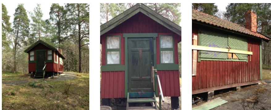
Stuga nr 77.

karaktär. Ligger med sin längdriktning mot höjdd kurvorna och har en slank huskropp. Stugan har kvar äldre fasadmaterial, bl a återanvända dörrblad och fönster som är äldre än stugan. Gavelingång med dörrblad från tidigt 1900-tal, gavelfönstren är troligen äldre. Står på plintar av "sparbetong" (betong uppblandad med besparingssten), vanligt förekommande i betongens barndom och åren kring andra världskriget. Faluröd locklistpanel, grönmålade foder, fönster och fönsterluckor. Detta, tillsammans med takets tegelpannor, gör att stugan får en enkel nationalromantisk karaktär, vilket var vanligt förekommande ännu under mellankrigstiden.