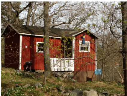
Stuga nr 75.

Stuga nr 75 (+) . Ligger på en väl synlig plats intill vägen på centrala ängen, på backen ner mot Skurusundet. Långsmal huskropp med liten sidoställd farstukvist, plintgrund med vissa täckta delar. Faluröd locklistpanel, tunna vitmålade foder och små spröjsade fönster. Mot Skurusundet får gaveln sin karaktär av ett smalt fönsterband från knut till knut. Flackt tunt sadeltak med pappbeklädnad. Stugan omges av kallmurade terrasseringsar. Värdet förstärks av det centrala läget.