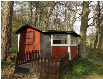
Stuga nr 9.

ursprungsdelen tydligt. Verandan bör ha tillkommit tidigt i stugans historia och är uppbruten med liggande spröjsade fönster. En äldre ek står nära verandans norra knut. Taket är pappklätt, fasaderna utgörs av faluröd stående panel. Knutar och fönster är vitmålade.