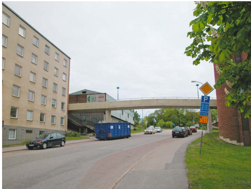
Ektorpsvägen med gångbron till Ektorps Centrum

Området är idag bebyggt med ett bostadshus och en kommersiell byggnad i två plan.