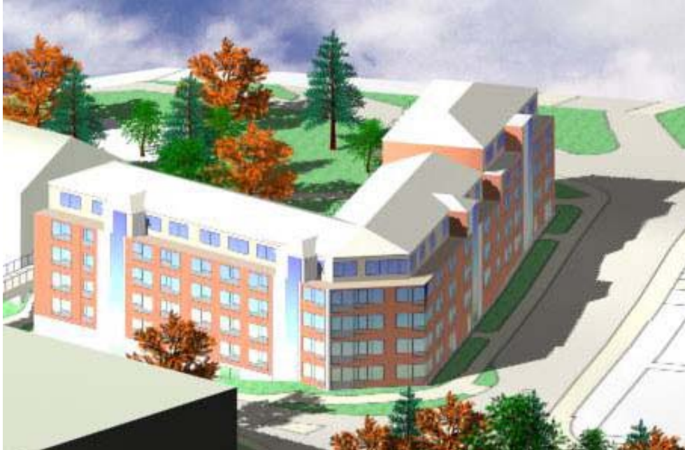
Fasader mot gatan

Samtliga lägenheter har tillgång till tyst sida för minst hälften av boningsrummen. Uteplatser och balkonger vetter mot gården och klarar ställda mål.