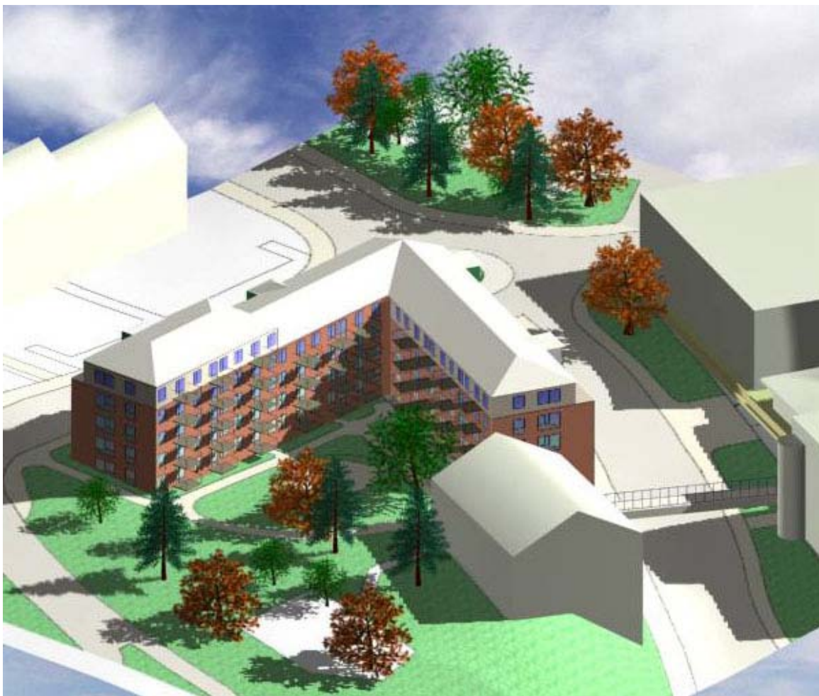
Gårdssidan i morgonsol

Huset angörs via garage från Ektorpsvägen med direktförbindelse trapphus/hiss till våningsplanen. De fyra entréerna från Ektorpsvägen och Lasarettsvägen ger direktförbindelse via trapphus/hiss till våningsplanen men också till gården.