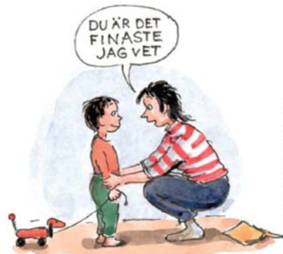
ILLUSTRATION: CECILIA TORLUND

Att vara förälder är världens roligaste och mest utmanande uppdrag! I Nacka vill vi göra vad vi kan för att stärka dig som förälder.