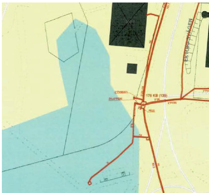
Bilaga tillhörande yttrande från Skanova

även bekostar den. Skanova utgår från att nödvändiga åtgärder i telenät till följd av planförslaget kommer att framgå av planhandlingarna.