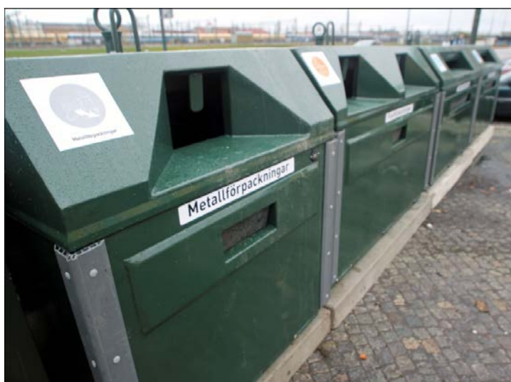
Exempel på krantömmande behållare.

Redan idag har nya behållare placerats ut på återvinningsstationen. Alla behållare är nu krantömmande och i mer enhetligt utförande. Vissa behållare byts ut successivt beroende på gällande avtal. En ny typ av ljuddämpande glasbehållare finns framtagen och kan komma att placeras ut. Dessa behållare dämpar ljudet som uppstår när förpackningar lämnas i behållaren. Behållarnas placering i förhållande till planket har också en viss ljuddämpande verkan.