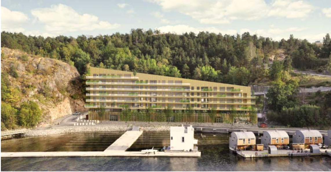
Illustration av nytt flerbostadshus innehållande högst 45 lägenheter och parkering