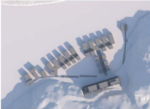
21 mars kl 09.00