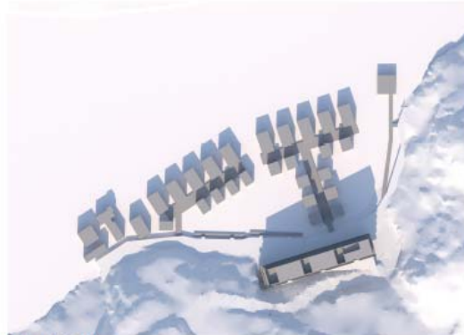
21 mars kl 12.00