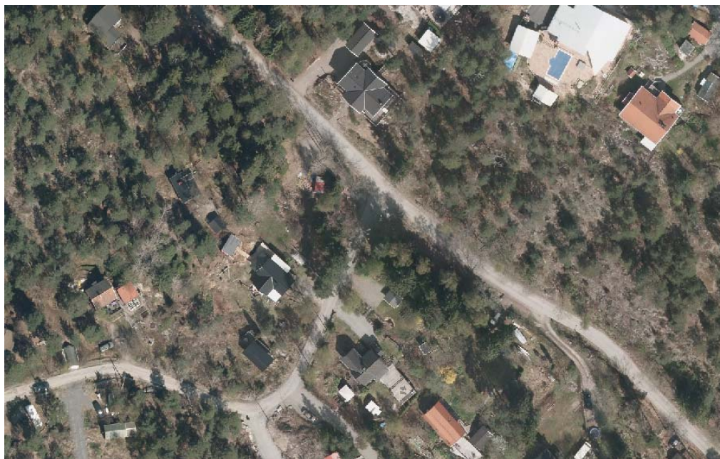
Korsningen Gösta Ekmans väg – Enbacken före utbyggnad. Flygbild från 2012.