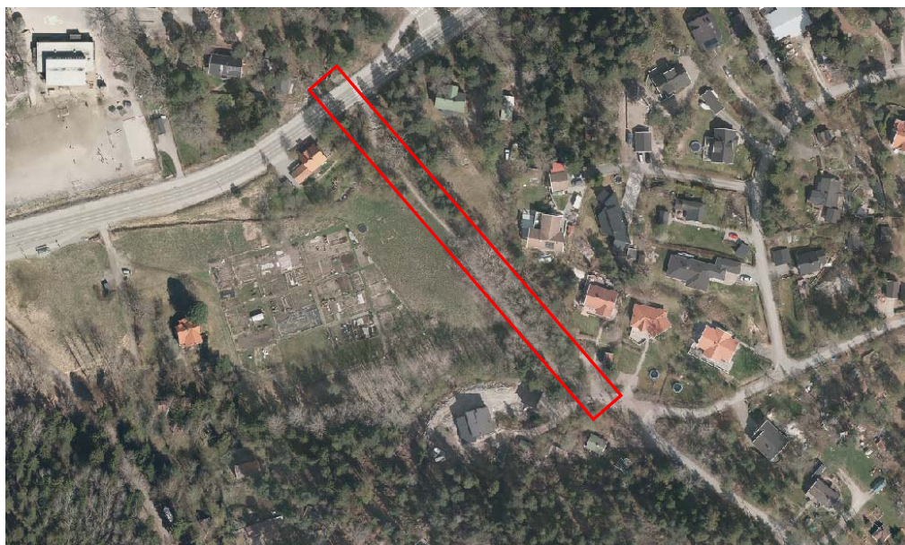
Området angöring till Värmdövägen före utbyggnad. Flygbild från 2012.