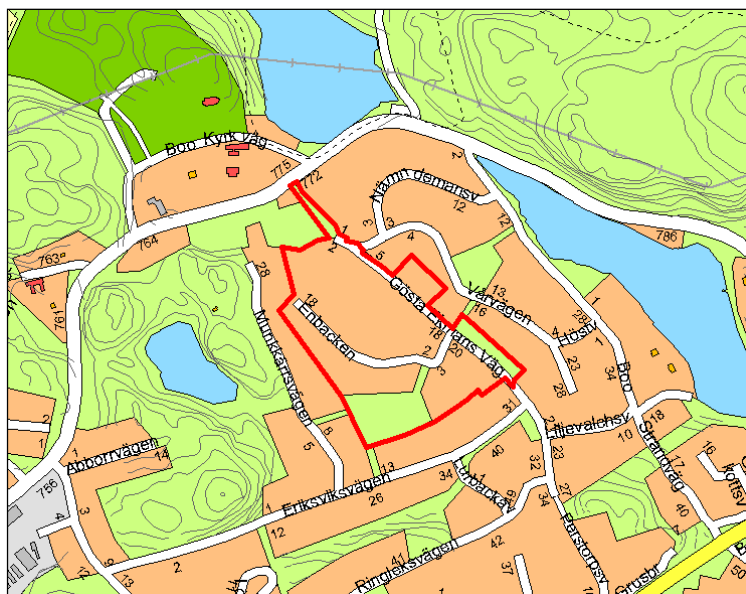
Karta som visar projektområdet med röd linje.