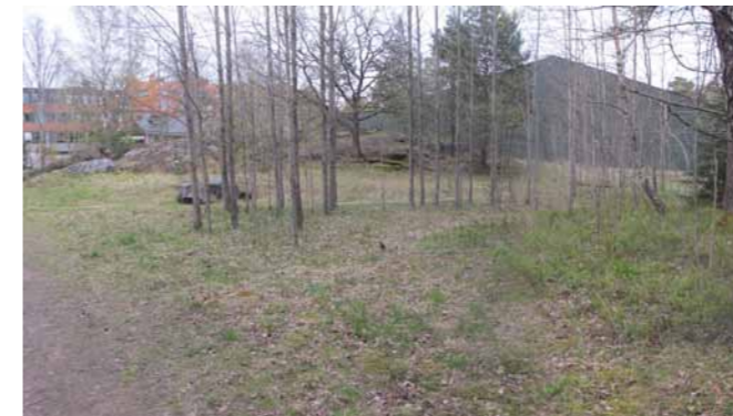
1 Nuvarande situation. De smala asparna i bild avverkas för att ge plats för det nya utegymmet.