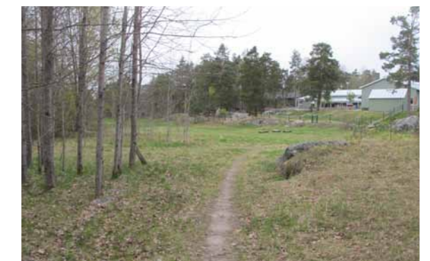
4 Stig från ishallen upp mot den nya utegymmet som kommer ligga till vänster i bild. Daghem i bakgrunden och golfbana till vänster.