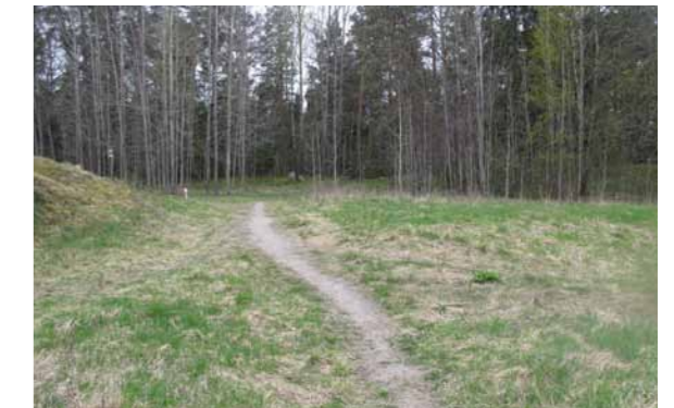
3 Bild tagen från skolan. Plats för den nya angöringen som används för underhåll. Gymmet placeras till vänster i bild