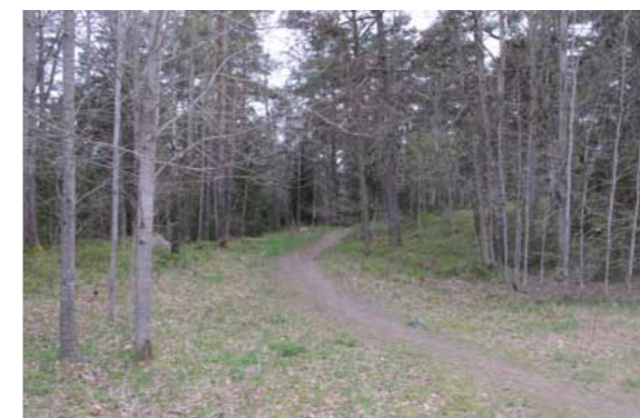
2 Bilden visar stigen upp mot elljusspåret. Där fotografen står kommer det nya utegymmet placeras.