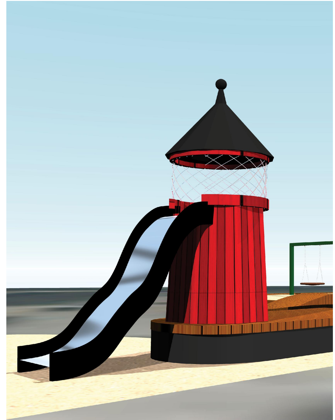
En stor fyr med rutsch ger platsen karaktär och många skratt.