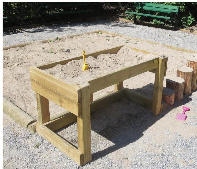
Baksandbord som går att komma åt även för den som sitter i rullstol eller som hellre står upp.