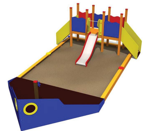
Sandlåda i form av båt. Klätterställningen på denna bild ersätts av sandbord för rullstolsburna barn.