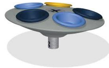
Tillfällig snurrelek som rymmer alla barn.