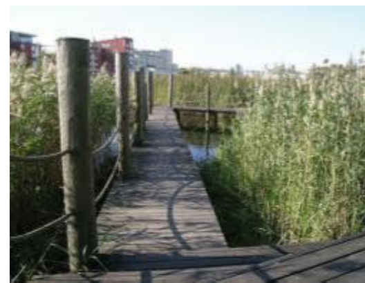
Träbrygga att springa eller sitta på.