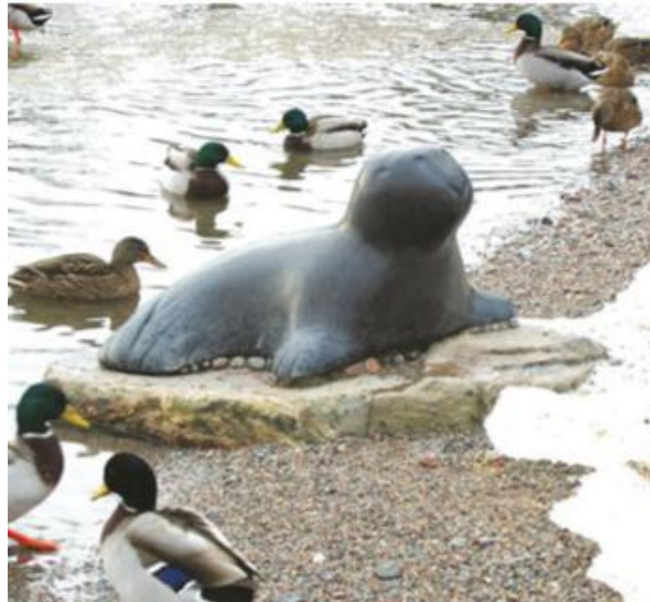
En säl att klappa eller sitta på.

Två lekhus i form av sjöbodarna lockar till lek. Upp till bryggan leder en ramp, så även en rullstol kan ta sig upp.