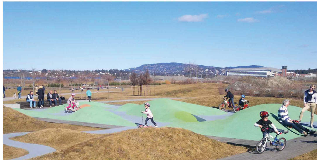
Den befintliga asfaltsytan görs om till en rolig, guppig yta för barnvagnar, sparkcyklar, cyklar eller att bara springa på.