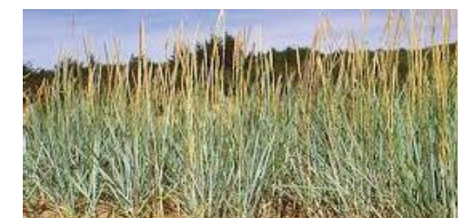
Högt, tåligt gräs avgränsar lekplatsen och ger en känsla av strand.