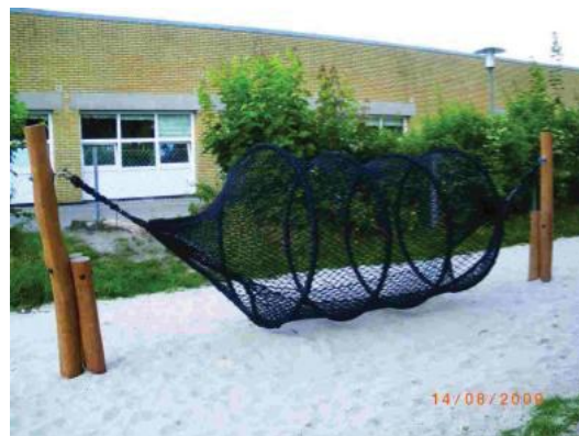
Rullnät blir en härlig plats att leka eller hänga på

På en av öarna placeras en hög fyr. Barnen når upp i fyren genom att klättra upp på klätternät och kommer ner med en lång rutsch. Intill fyren finns en rolig karusell där alla barn kan sitta tillsammans i grunda koppar. Intill "ön" finns en träbrygga att sitta eller springa på.