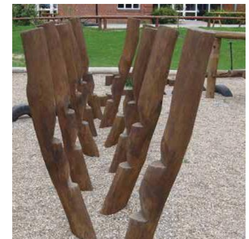
Styltor är ett roligt inslag på balansbanan.