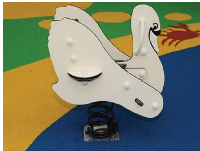
Gungsvanar med ryggstöd.