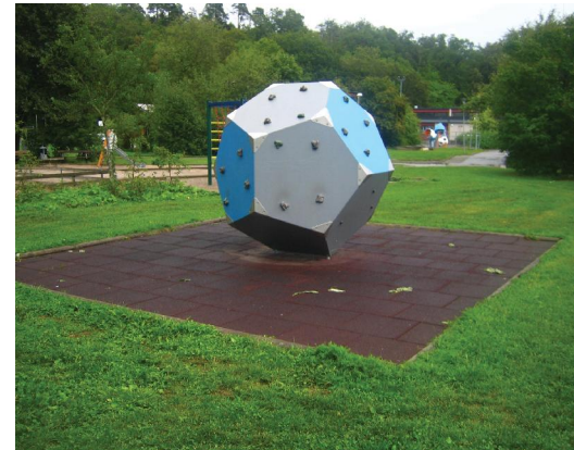
Den befintliga klätterleken flyttas och får sand som fallskyddsunderlag.