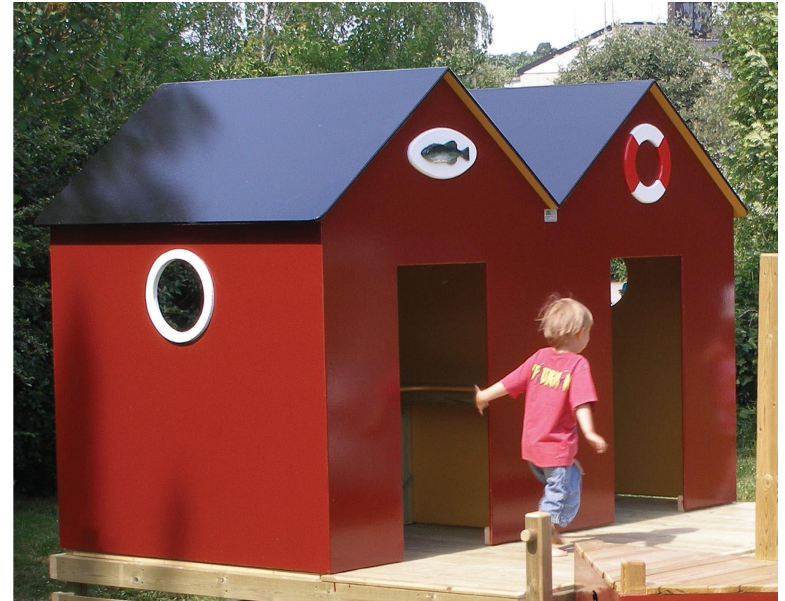
Sjöbodarna fungerar som lekstugor och kan i barnens ögon förvandlas till kiosk, bostadshus eller vad helst fantasin tillåter.