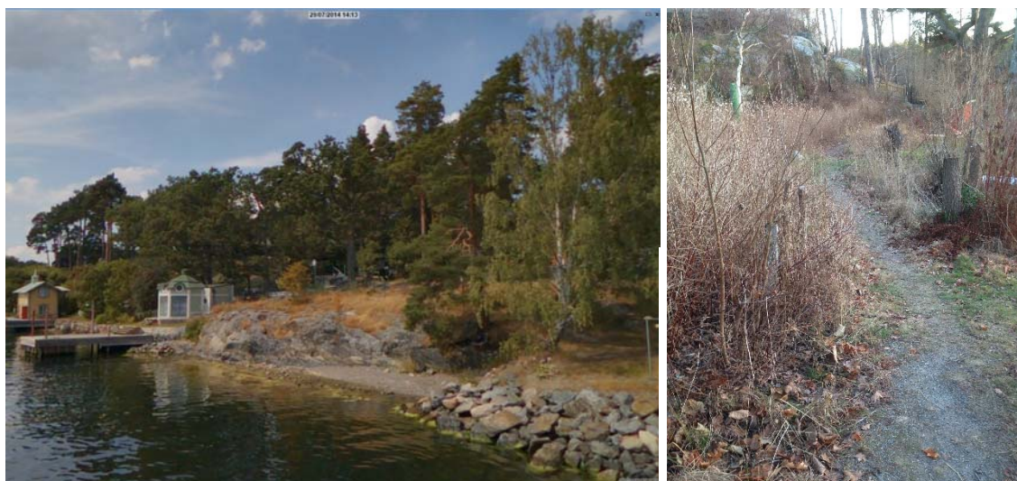
Vänstra bilden: Östra änden av strandpromenaden. Högra bilden: Så här ser gångstigen ut idag.

En utbyggnadspromemoria för projektet godkändes av kommunstyrelsen den 20 augusti 2012. Sedan dess har förutsättningarna för strandpromenaden förändrats i sådan utsträckning att det behövs ett nytt beslut om att fortsätta med utbyggnaden.