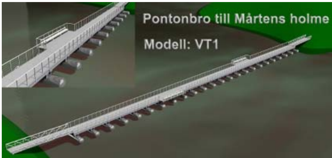
Figur 3 Illustration av bron.

Pontonbro är en flottbro som stöds av flytande pontoner med tillräcklig flytkraft för att stödja bron och dynamiska belastningar. En pontonbro behöver inte bottenförankring och är ur underhållssynpunkt lätt att hantera då pontonerna kan bytas ut för underhåll samtidigt som bron är i drift.