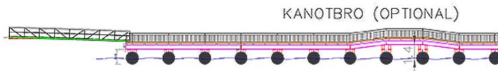
Figur 5 Illustration av bron sett från sidan.