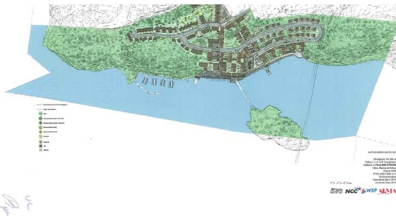
Figur 1 Detaljplan för del av Tollare 1:16, delområde 2 – Tollare Strand från kajen, strax väster om Tollare hamntorg.

Av exploateringsavtal som antogs av kommunfullmäktige den 31 januari 2011, punkt 6.5 i bilaga 4, framgår att bron ska utföras som flytbro utan bottenförankring. Bron ska ha ett yttskikt som möjliggör halkbekämpning, vara försedd med räcken, ha en möjlighet för kanoter och roddbåtar att passera under, förses med sittmöjligheter/bänkar ungefär mitt på bron samt förses med livräddningsutrustning.