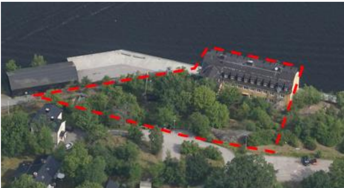
Figur 1. Detaljplanområde Sicklaön 276:1 och dess uppvuxna till stora träd.

Detaljplanområdet utgörs av tomtmark (Figur 1). Området utgörs av en trädgård i en slänt bakom huset samt hus. I slänten växer några träd, främst unga samt uppvuxna lönnar och ekar och en yngre ask EN (Figur 2). Tre av träden innehåller bohål och på flera träd har fågelholkar monterats (Figur 2). I områdets västra del står två döda träd. I buskskiktet växer en större syrenbuskar samt några ros- och snöbärsbuskar. Det förekommer en hel del berg i dag samt stora stenblock. Fältskiktet kunde pga snö inte bedömas.