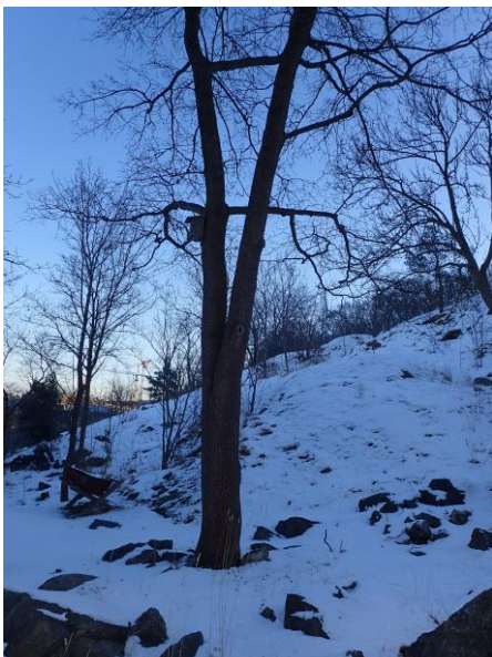
Figur 3. Uppvuxen lönn med bohål och fågelholk. .