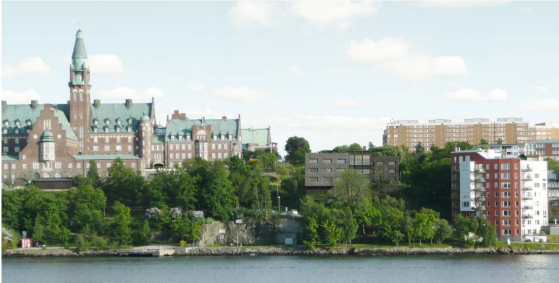
Bild 2, Fotomontage från norr som visar vårdboendet vid övre Varis med Danviks Hospital i bakgrunden