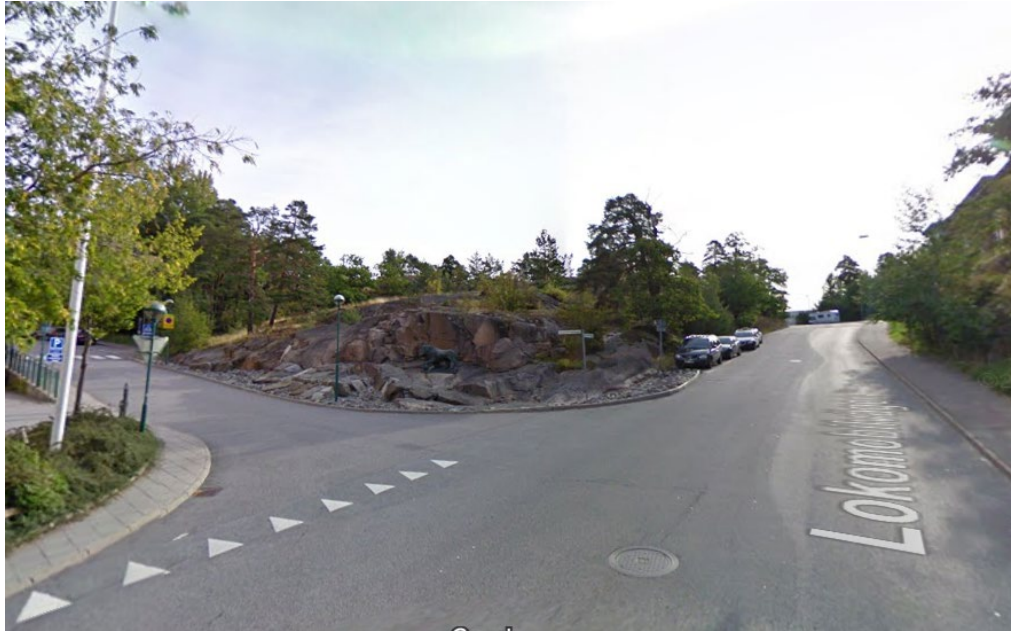
Vy från Lokomobilvägen, före utbyggnad