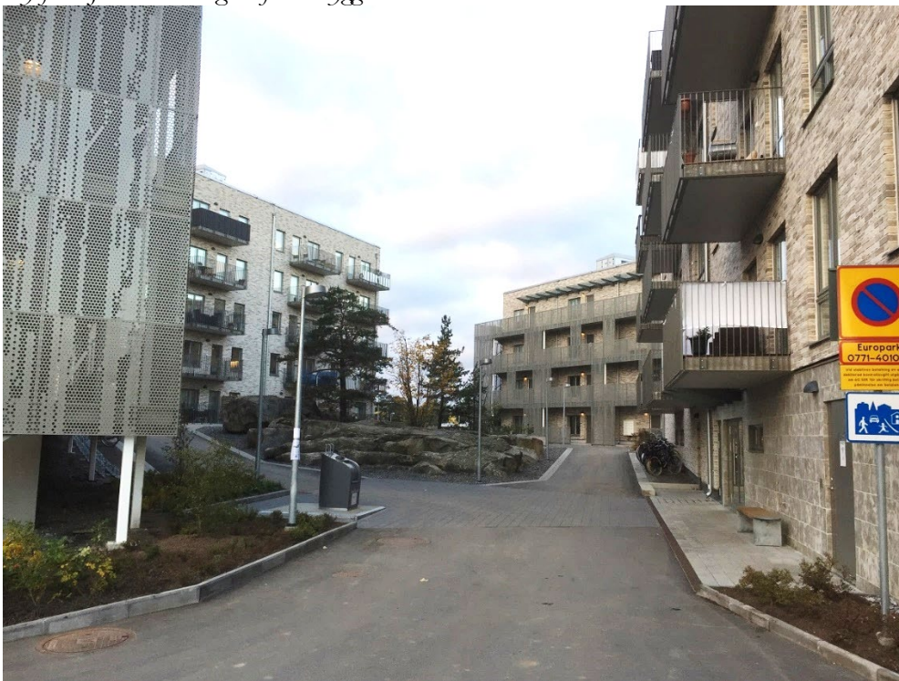
Vy mot innergården efter utbyggnad..