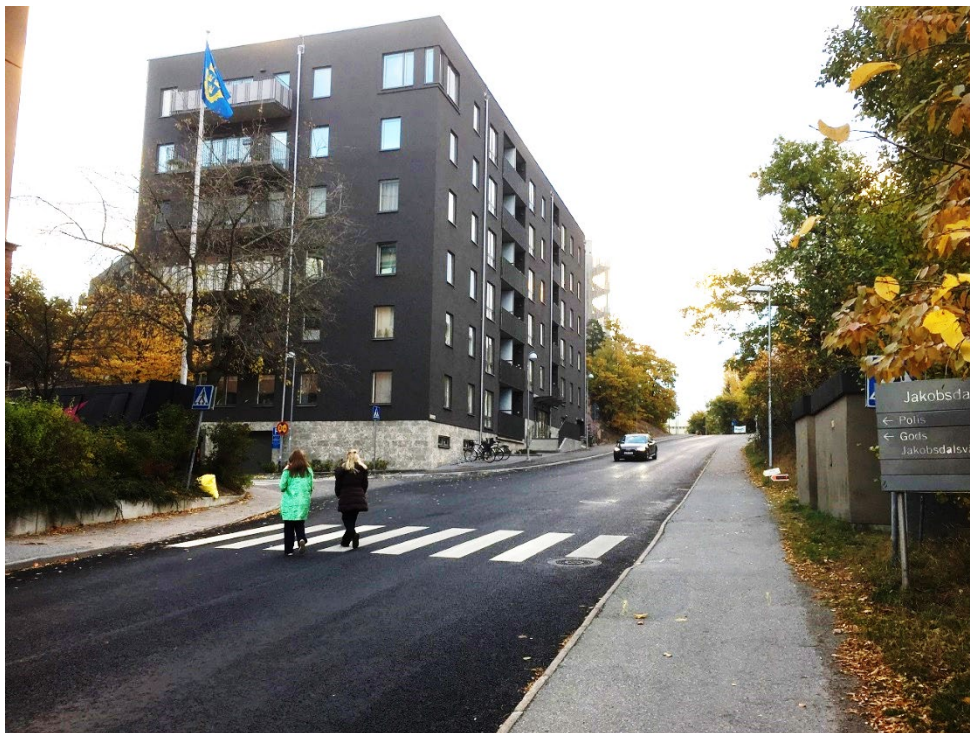
Vy från Lokomobilvägen, efter utbyggnad.