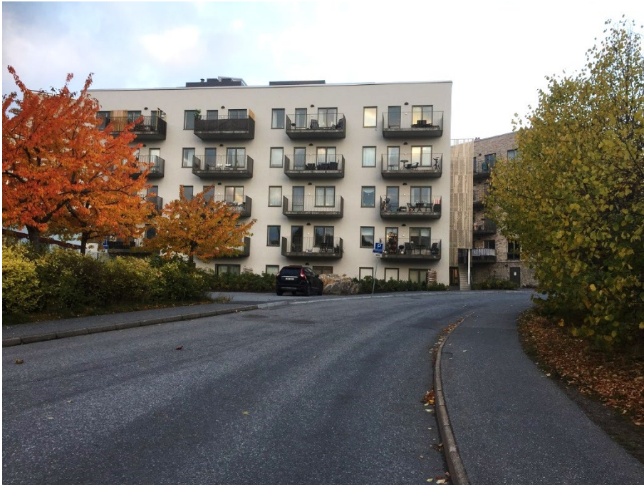
Vy från Fyrspannsvägen, mot nordväst, efter utbyggnad.