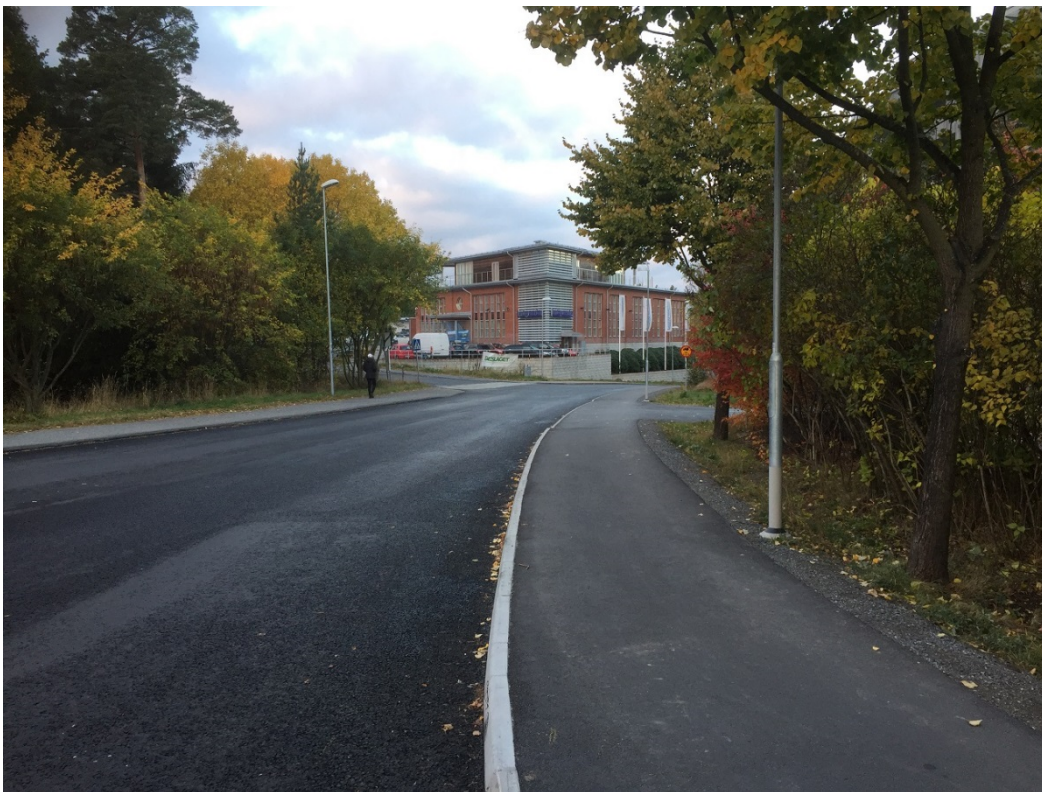
Ny gångbana/ trottoar med belysning.