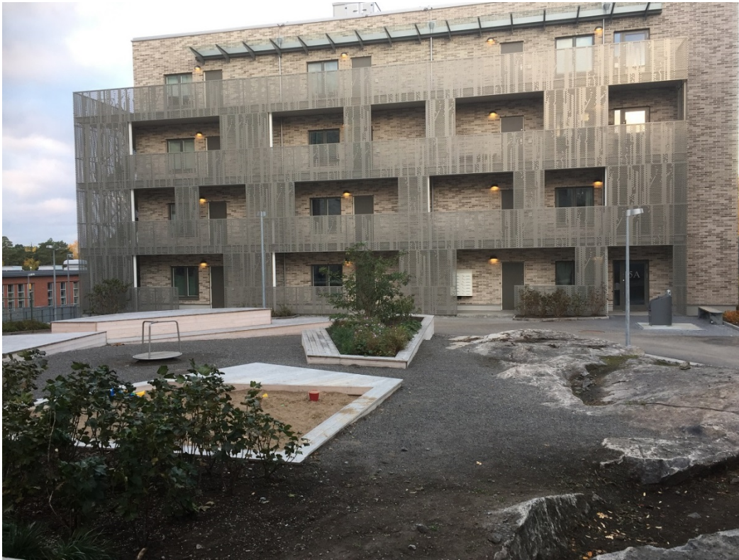
Vy mot innergården efter utbyggnad.