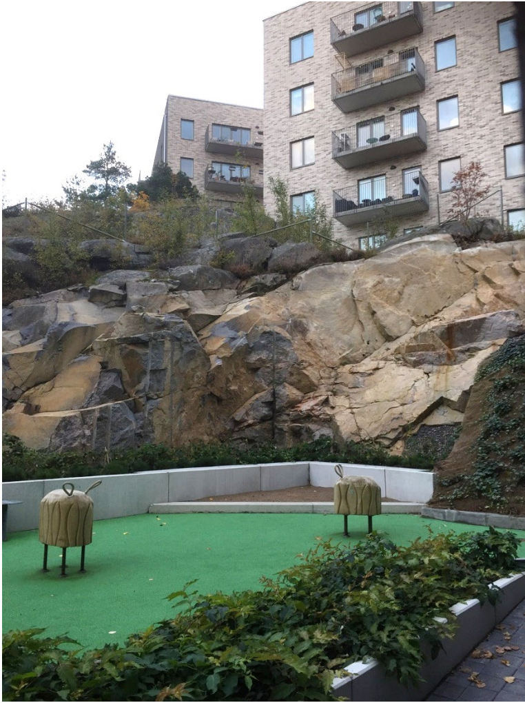
Vy från Jakobsdalsvägen efter utbyggnad.