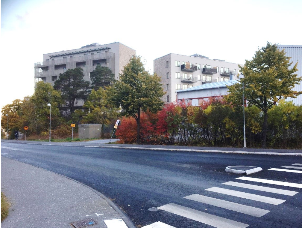
Vy från Lokomobilvägen, mot väster, efter utbyggnad.