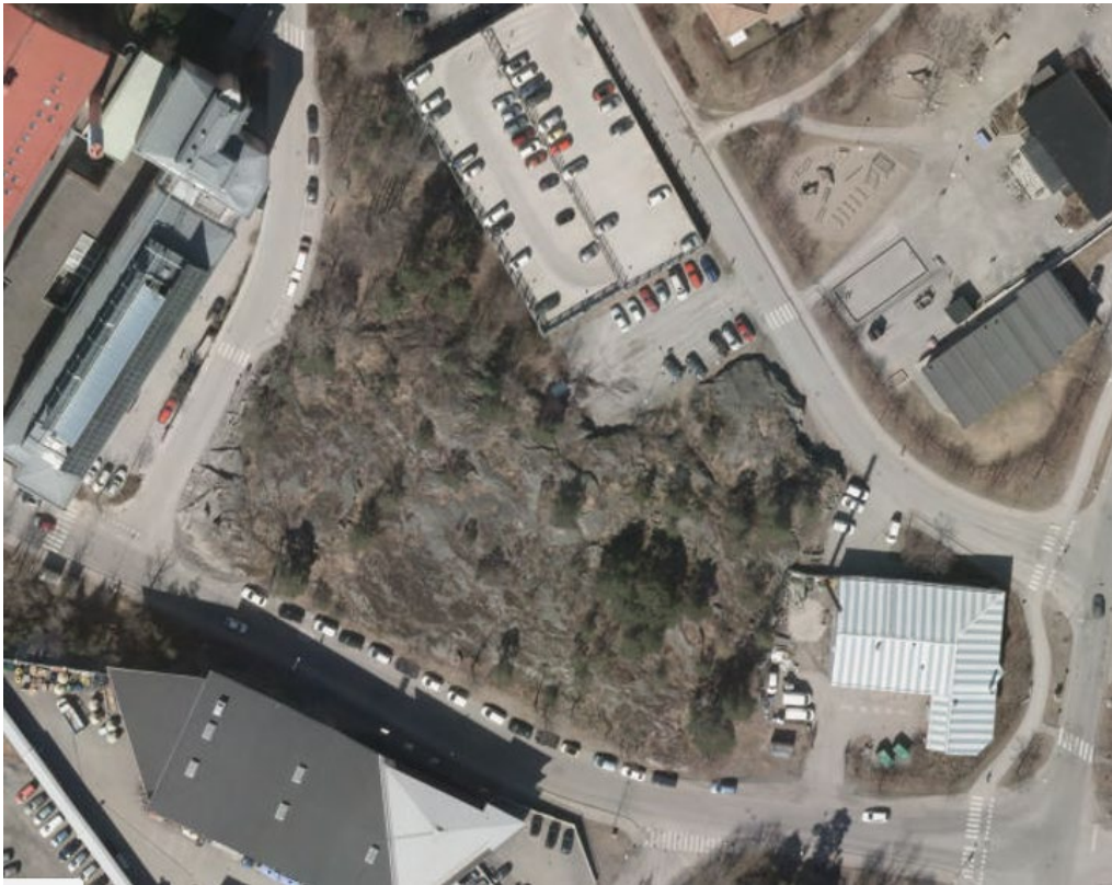
Området före utbyggnad. Flygbild från 2013.