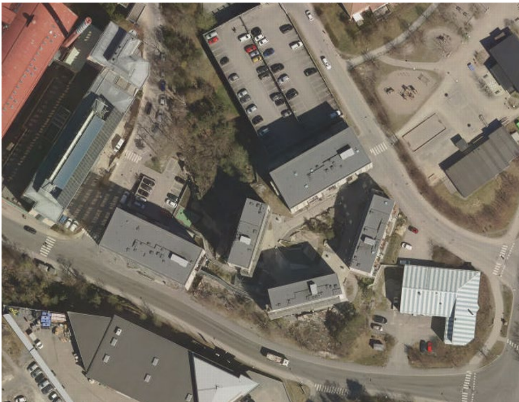
Området efter utbyggnad. Flygfoto från 2017.