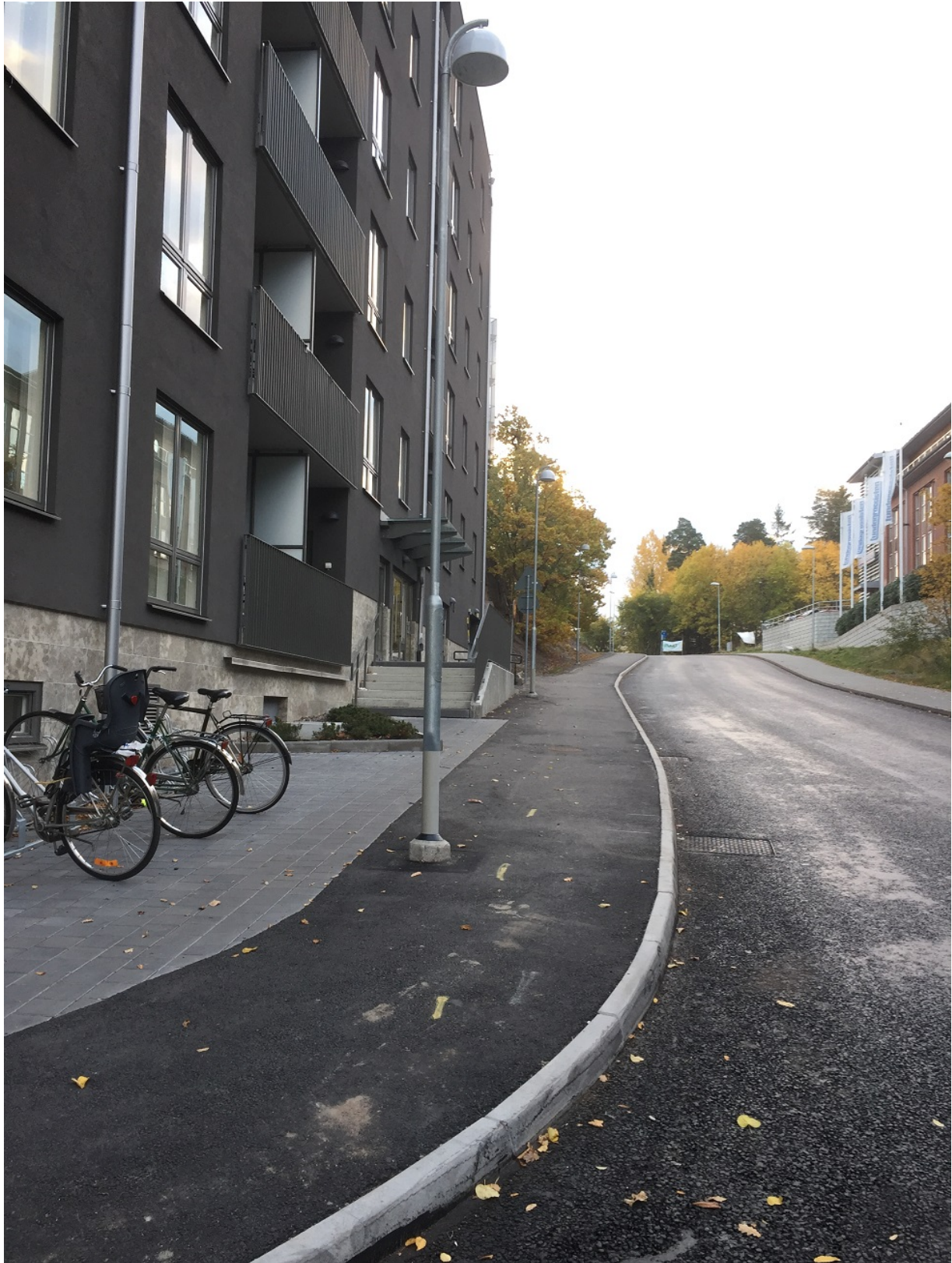
Ny gångbana/ trottoar med belysning