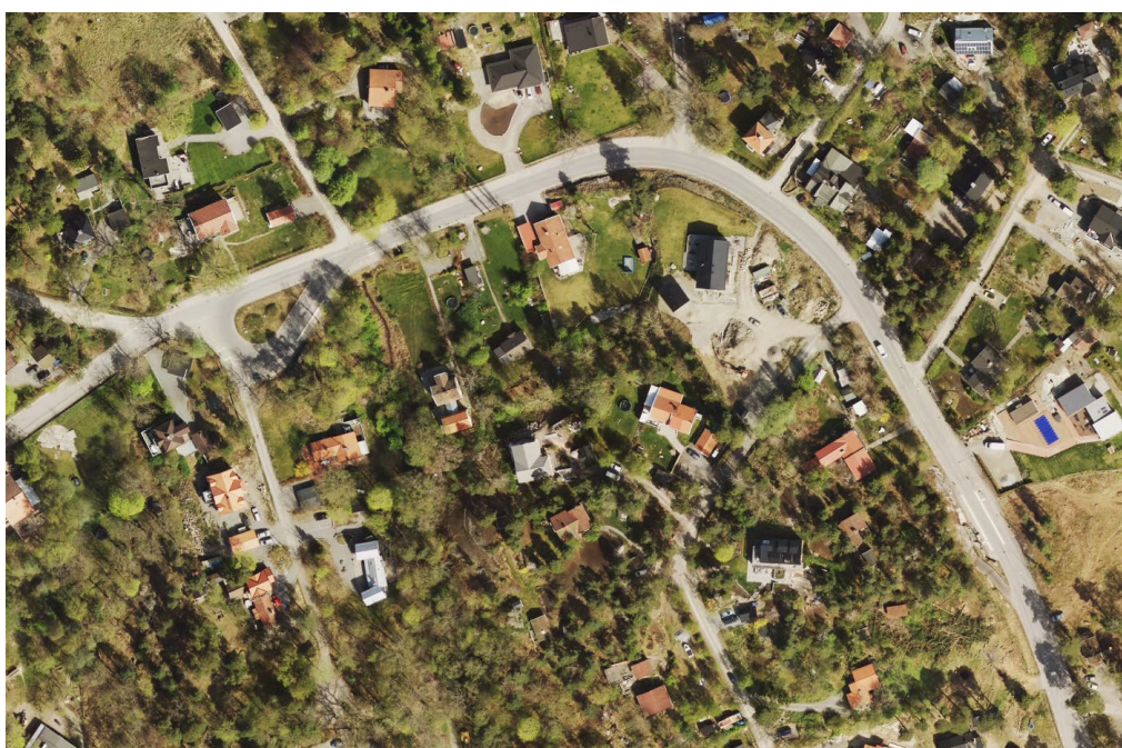
Del av Kummelnäsvägen efter ombyggnad