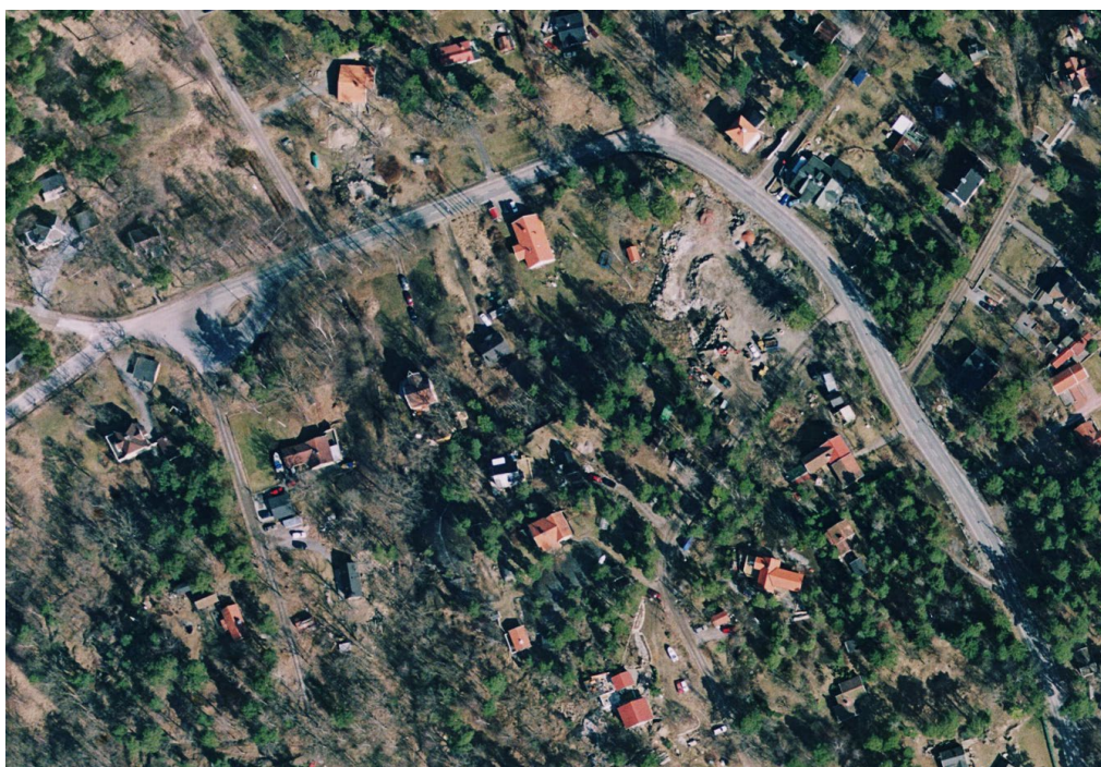
Del av Kummelnäsvägen före ombyggnad