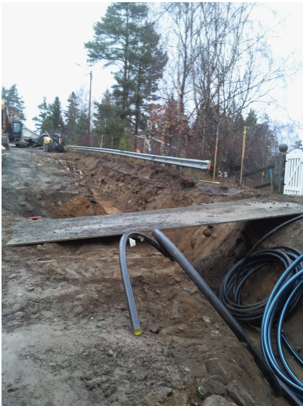
Schakt för vatten- och avloppsledningar