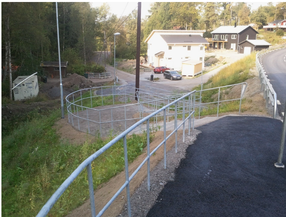
Kummelnäsvägen efter ombyggnad, med ny trappa