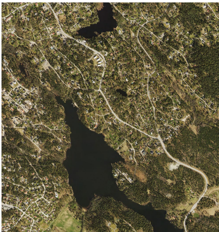
Flygfoto över Kummelnäsvägen efter ombyggnad