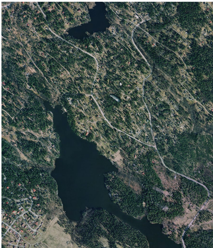
Flygfoto över Kummelnäsvägen före ombyggnad