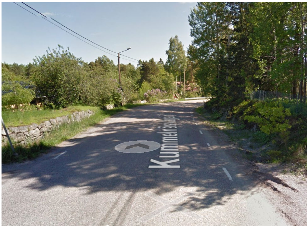
Kummelnäsvägen före ombyggnad