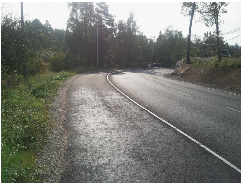
Kummelnäsvägen efter ombyggnad, med ny gångbana