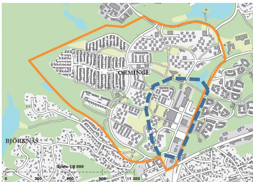
Figur 2 Preliminära området för den upphandlade totalentreprenaden i utökad samverkan som omfattar om- och utbyggnad av allmänna anläggningar i Orminge centrum (streckad linje) men även om- och utbyggnad av allmänna anläggningar i angränsning till Orminge centrum (orange linje), exempelvis projekt i Kraftledningsstråket.

ledningsägare uppskattas uppgå till cirka 650 miljoner kronor för samma område. Nedan följer en mer detaljerad beskrivning av dessa inkomster och utgifter.