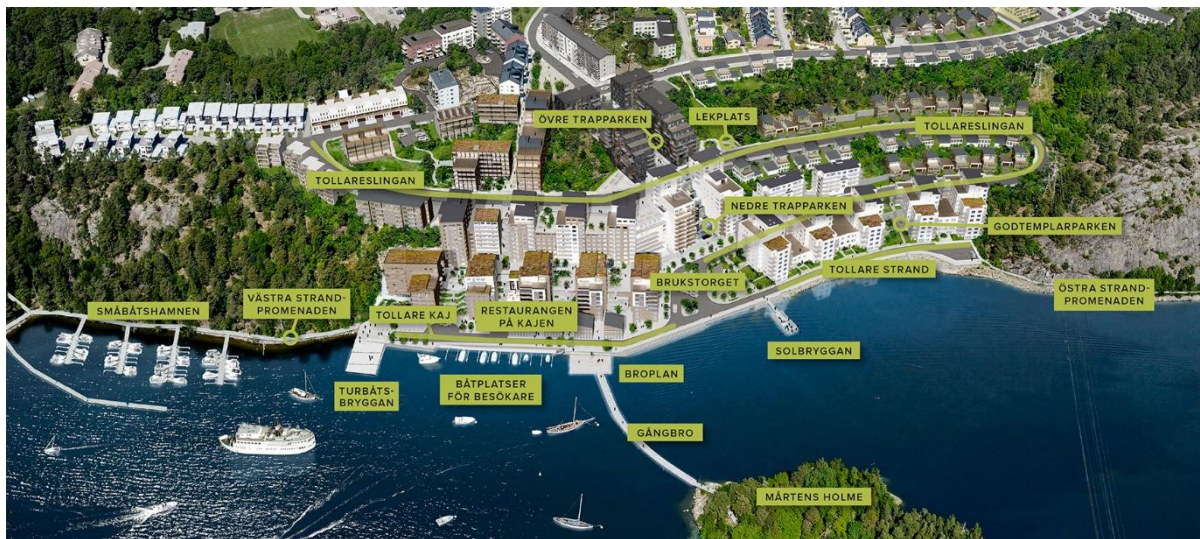
Figur 2 Skiss Tollare, Bonava