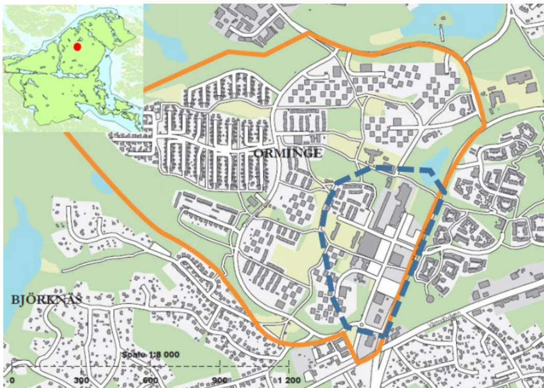
Bild 1. Kartan visar områdets avgränsning, den blåstreckade linjen markerar planprogramområdet. Den lilla kartan visar var i Nacka kommun området ligger.

bostäder och lokaler för ett tryggt, tillgängligt och attraktivt stadsdelscentrum för alla boende och verksamma. Ordnanandet av allmänna platser inom planprogramområdet för Orminge centrum sker samordnat genom stadsbyggnadsprojektet Samordning Orminge C, huvudprojekt nummer 93102387. Syftet är att uppnå samordningsvinster samt en flexibel och effektiv hantering för utbyggnad av allmänna anläggningar i samordning med byggandet av bostadskvarteren då utbyggnaden utgör ett gemensamt infrastruktursystem för stadsbyggnadsprojekten. Samtliga allmänna anläggningar inom planprogramområdet byggs i kommunens regi.