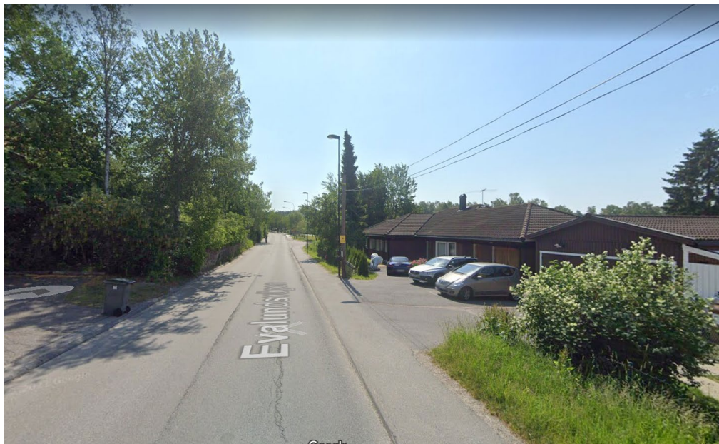
Streetview bild - Evalundsvägen

Nacka kommun strävar mot att alla barn ska ha en säker skolväg.