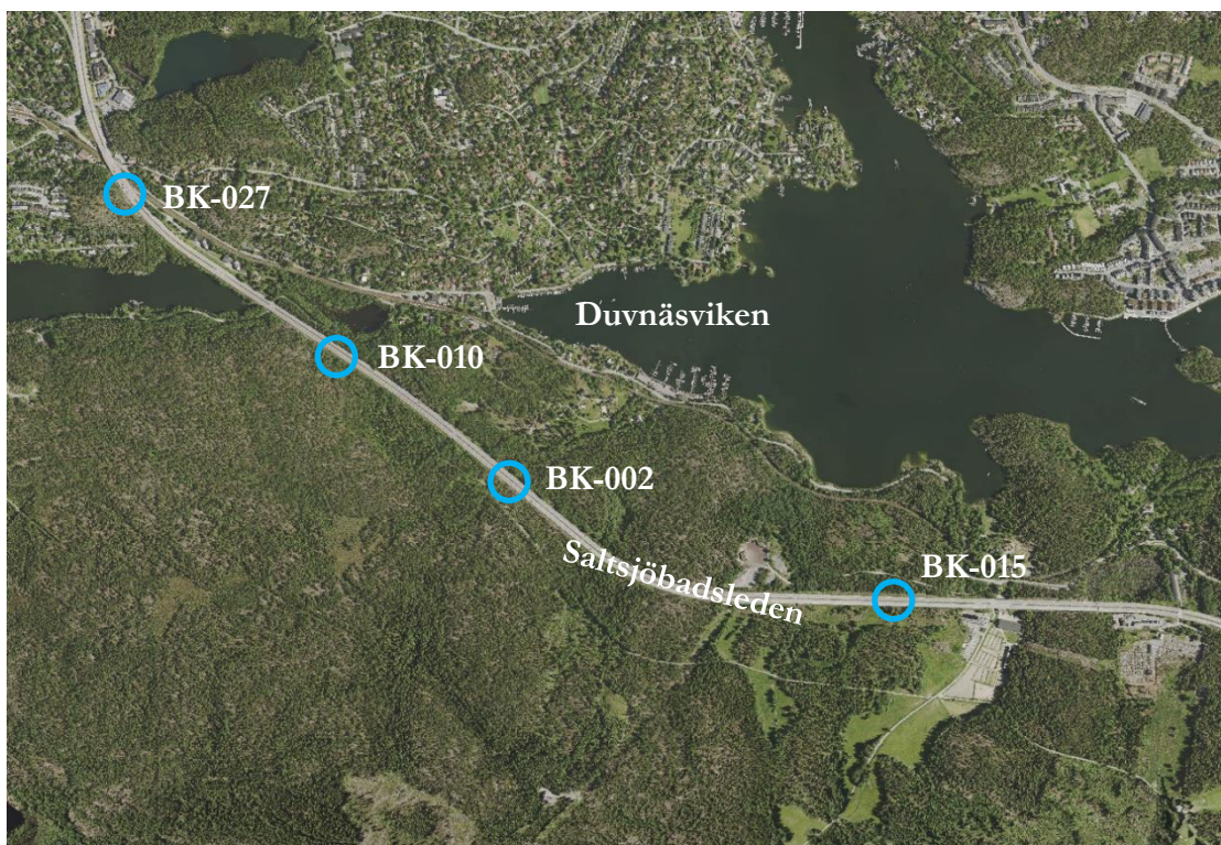
Figur 3: Flygfoto över objekt BK-002, BK-010, BK-015 och BK-027. Ortofoto 2022.